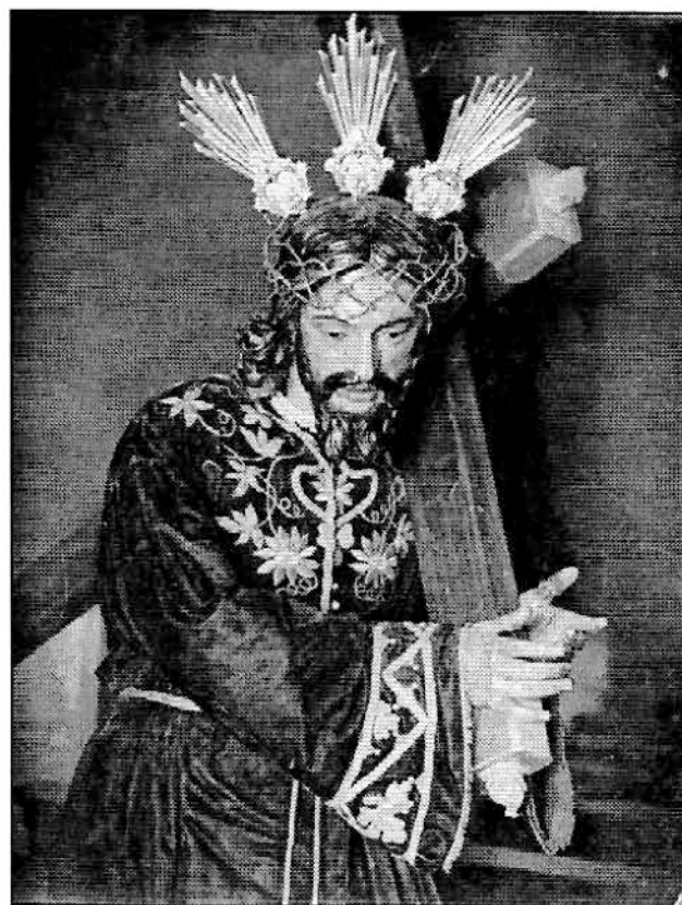
Nuestro Padre Jesús Nazareno (talla anónima de 1643). (Foto: Archivo Particular del Autor - Colección Juan Labao Díaz).

"Ilmo. Señor: La iglesia del Sr. Santiago (Parroquia que fue de esta ciudad de Tarifa muy frecuentada del pueblo cristiano hasta el día de hoy) templo muy bueno y digno de que el olvido en sus reparos no ocasione su ruina, tiene un beneficio y tres capillas y entierros, con capellanías que se cantan y otras muchas memorias y fiesta el día del glorioso Apóstol su titular y por estar estas capillas co-