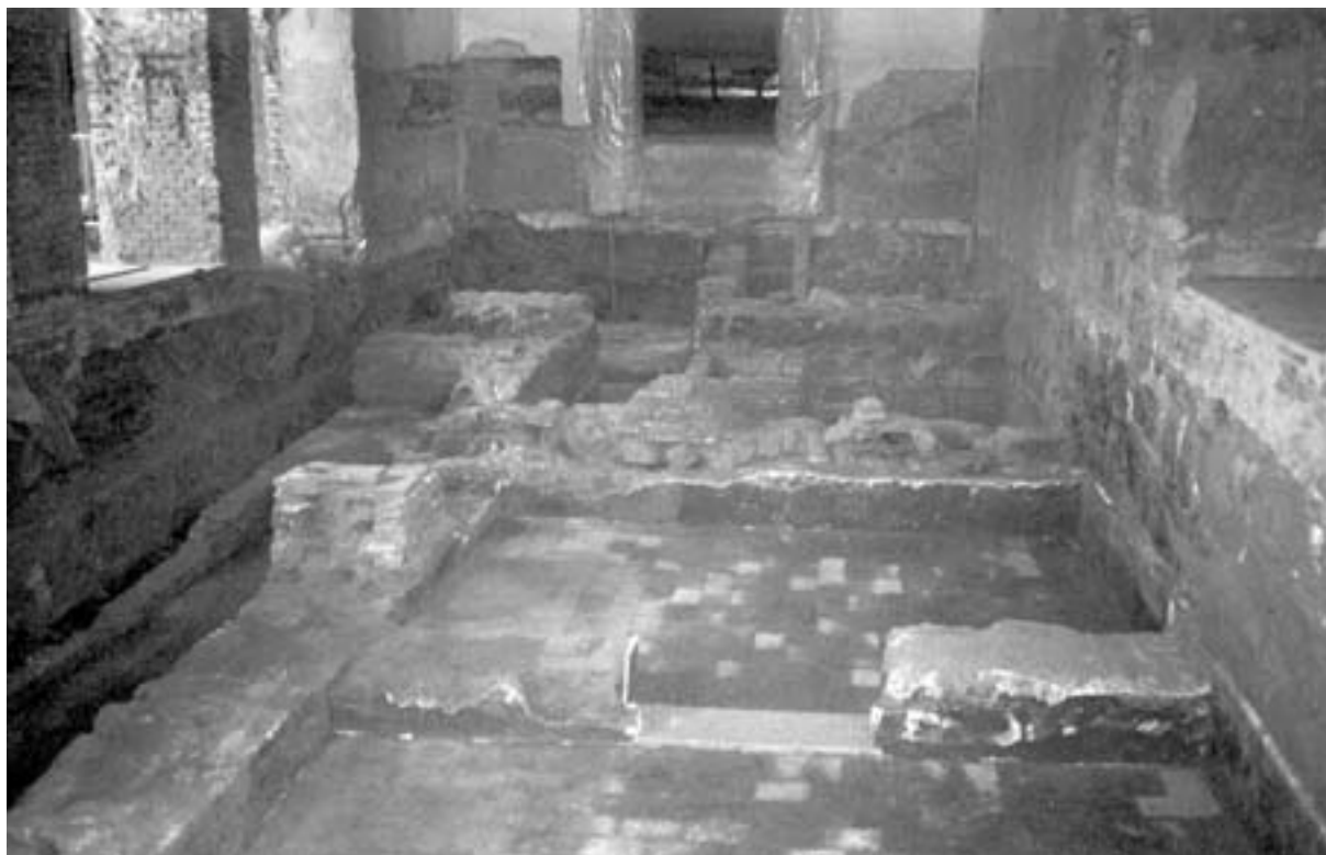
Fig. 2. Distribución espacial de los diferentes ámbitos reconocidos en la sala del Alfarje. Toma realizada desde el norte.

accede desde el este a través de una entrada porticada. Desgraciadamente solo nos ha sido posible excavar una parte de la misma, por lo que desconocemos realmente su longitud, aunque, si tenemos en cuenta la disposición de otros muros registrados en sondeos practicados al norte de la sala y consideramos que la entrada se establece en el centro de esta, podemos presuponer que goza de una longitud de unos 10,40 m, lo que se traduce en una superficie de unos 42,81 m 2 . De este modo serían tres los vanos de acceso, cada uno de ellos con 1,82 m de anchura y separados entre sí por un basamento de 0,50 m de anchura, cuyo umbral queda remarcado mediante tres losas calizas en las cuales queda la huella de la quicialera de la puerta.