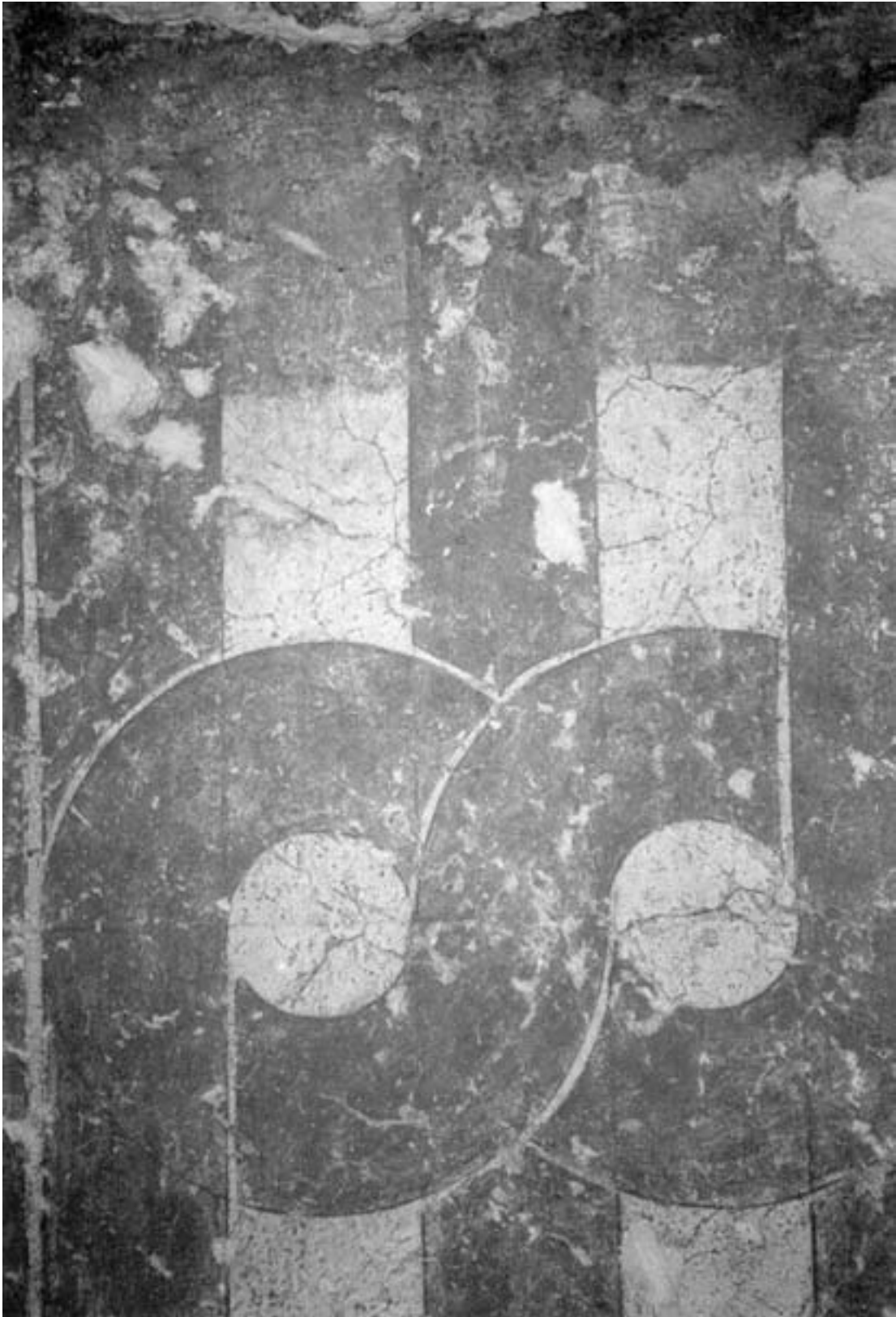
Fig. 3. Detalle del motivo decorativo plasmado en el zócalo de pintura mural del andén situado en el cierre meridional del patio.