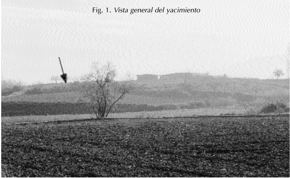
Fig. 1. Vista general del yacimiento

Esta villa cuenta con una necrópolis que está situada hacia el norte, entre el cerro y el camino real; los materiales cerámicos encontrados aquí se datan en época tardo-imperial (ss. III-IV) 3 .