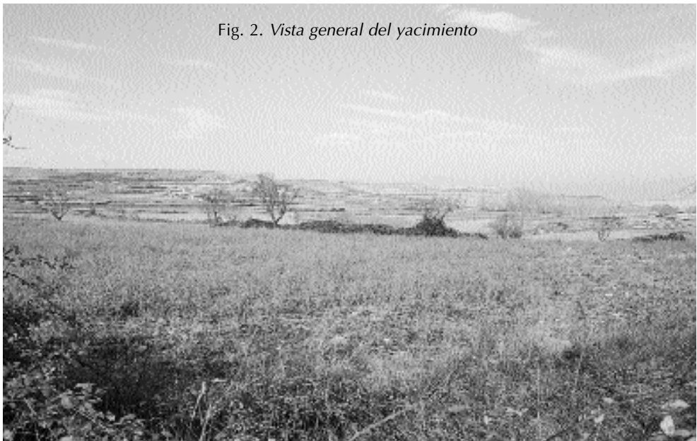
Fig. 2. Vista general del yacimiento