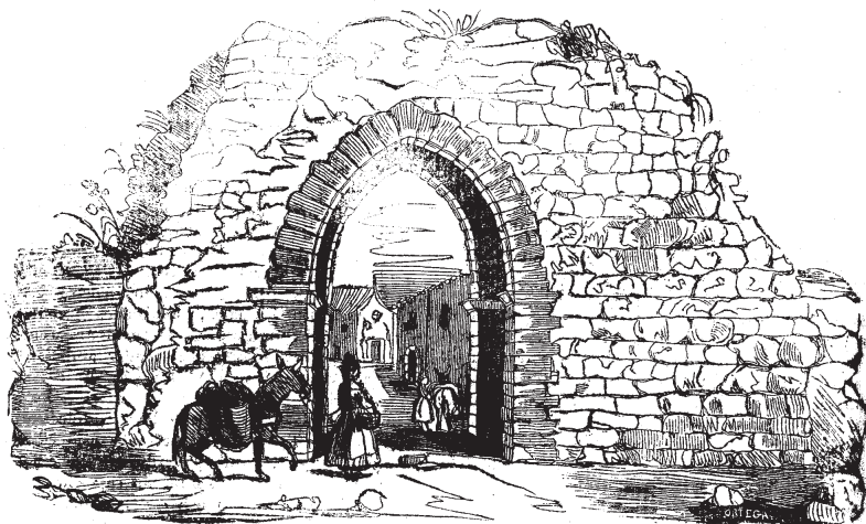
(Entrada antigua de Benavente).