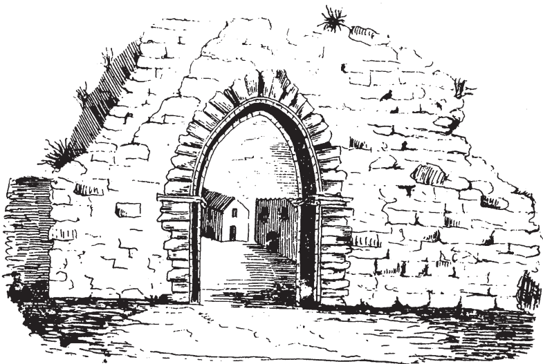
Antigua puerta de Benavente.