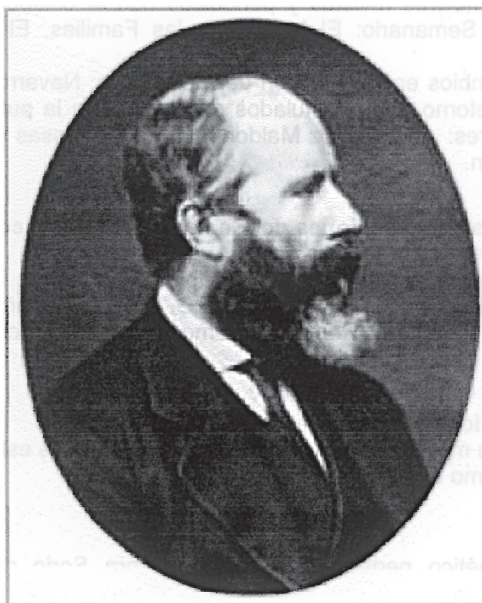
George Edmund Street

o David Roberts 13 , ya no busca lo pintoresco 14 , sino que, como arquitecto estudioso del gótico, trata de sistematizar los caracteres particulares del estilo de cada país que visita.