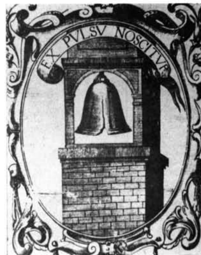
1 y 2. Relación entre el emblema XIX de Bruck y la empresa LIX de Saavedra.—3 y 4. Cotejo del emblema XVIII de Bruck con la empresa XXVIII de Saavedra.—5 y 6. Relación de dependencia entre el emblema XXV de Bruck y la empresa XI de Saavedra.