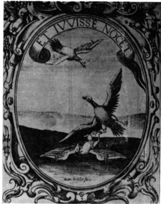
1 y 2. Estudio comparativo del emblema XXVIII de Bruck y la empresa XLVII de Saavedra.