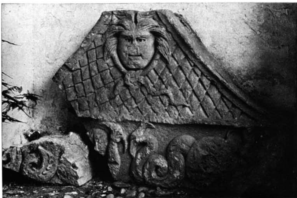
1. N.º 1.—2. N.º 2.