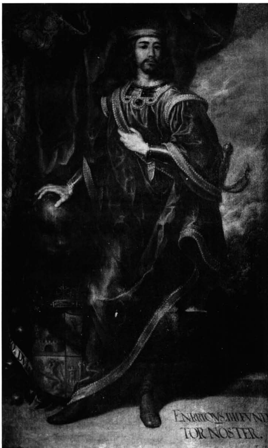
Granada. Universidad. Enrique IV.