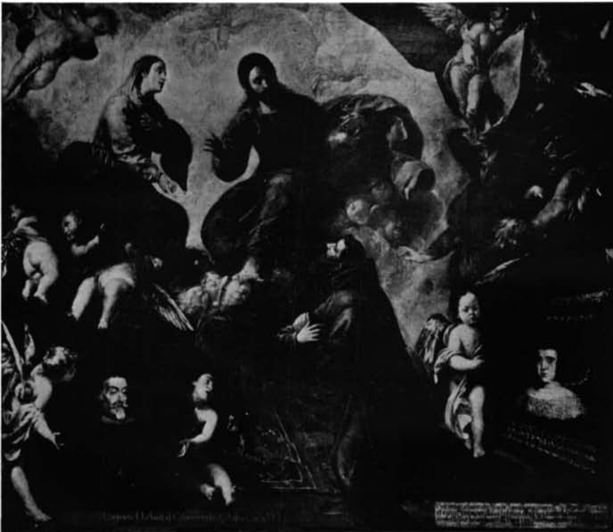
La Coruña, Museo de Bellas Artes. San Francisco de Asís en la Porciúncula, por Francisco Caro.