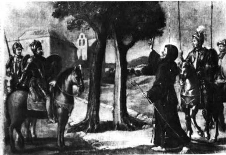
Sevilla. Museo de Bellas Artes. Pinturas de Lucas Valdés: 1. Milagro de la caldera.—2. Fuente milagrosa en el convento de Paula.—3. Resurrección de niños en el convento de Paula.—4. División milagrosa de un moral en el convento de Paterno.