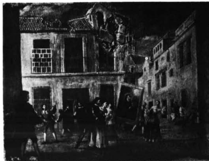
Sevilla. Museo de Bellas Artes. Pinturas de Lucas Valdés: 1. Curación milagrosa del Padre Fray Diego de la Mota.—2. El cuerpo de San Francisco de Paula es quemado por los hogonotes.—3. Retrato milagroso de San Francisco de Paula.—4. Terremoto detenido por intercesión de la imagen de San Francisco de Paula.