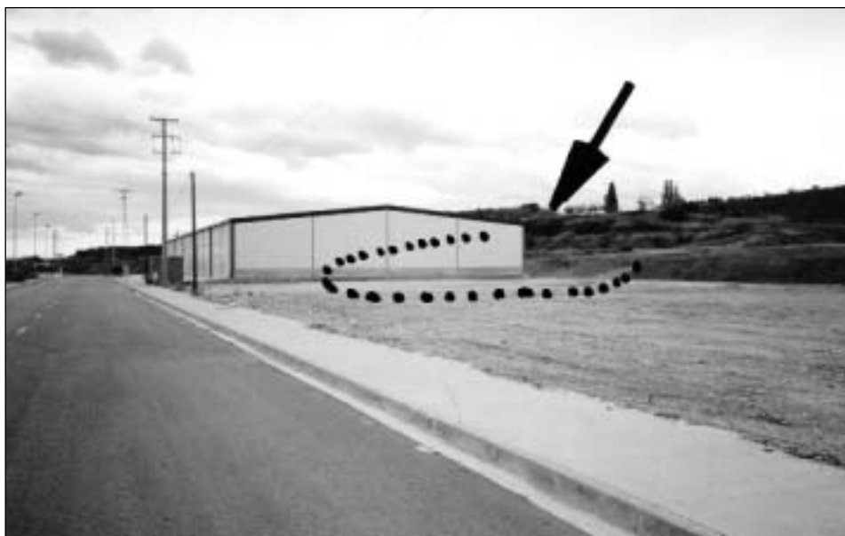
Lámina 1.- Señalado con una flecha, el lugar donde aparecieron los restos arqueológicos.

Desgraciadamente ha tenido que ser de nuevo la acción de las palas retroexcavadoras, las que han puesto de manifiesto la presencia de restos arqueológicos en la zona de Calahorra. En este caso, parece que lo desmontado no ha afectado en gran medida al yacimiento que se extiende más hacia el Sur, hacia unos terrenos que aún sin desmontar, tienen la calificación urbanística de zona verde. Tal circunstancia hace interesante una intervención arqueológica en la zona, y solo así podrá determinarse los múltiples interrogantes que este tipo de asentamientos plantea.