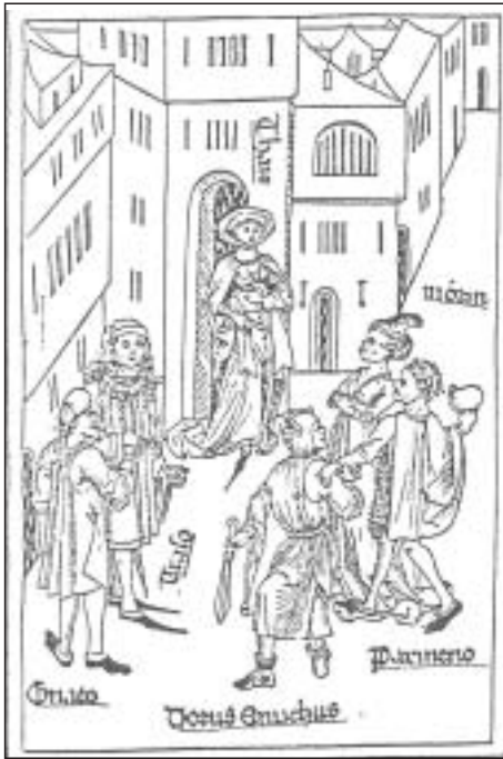
Fragmento del Heautontimorumenos , de Terencio. Manuscrito conservado en la Biblioteca Ambrosiana de Milán