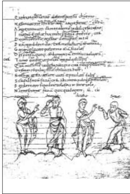
Escenas del “Eunuchus”