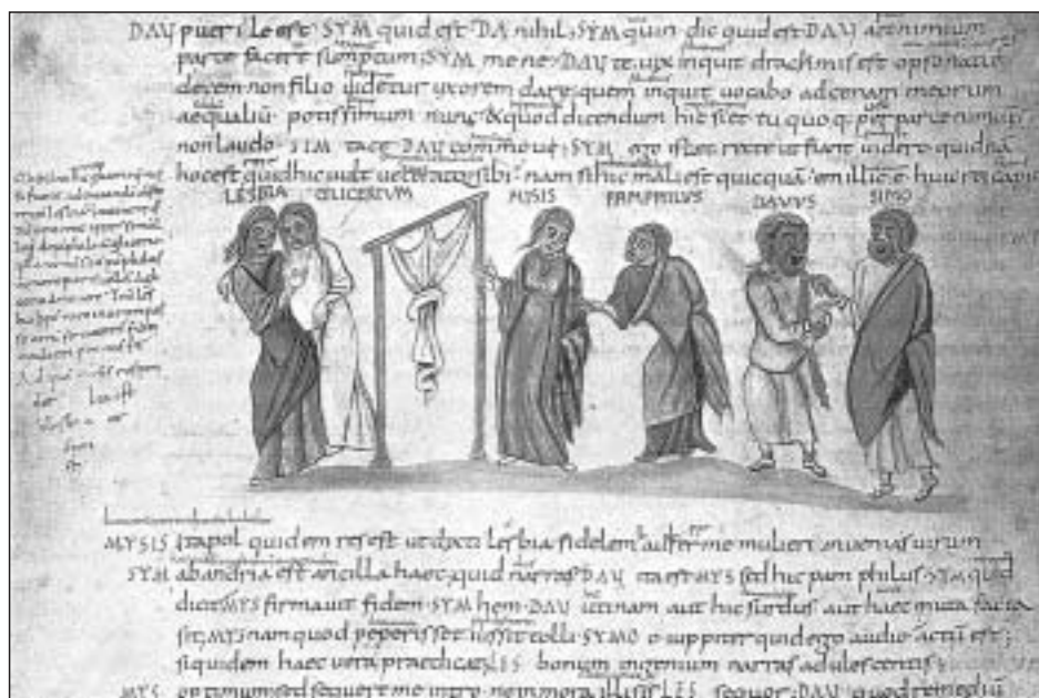
Terencio, Andria , con la miniatura de algunos personajes

Con letra y tinta posteriores a la signatura, se lee: Privilegio de la Mesta, 1481 , lo que nos llevaría a los reinos de Castilla y León, ya que en Navarra no existió tal asociación de carácter general, aunque sí mestas locales, como, por ejemplo, en Tafalla en época tardía. Entonces ¿cómo llegó al antiguo reino pirenaico? Problema insoluble.