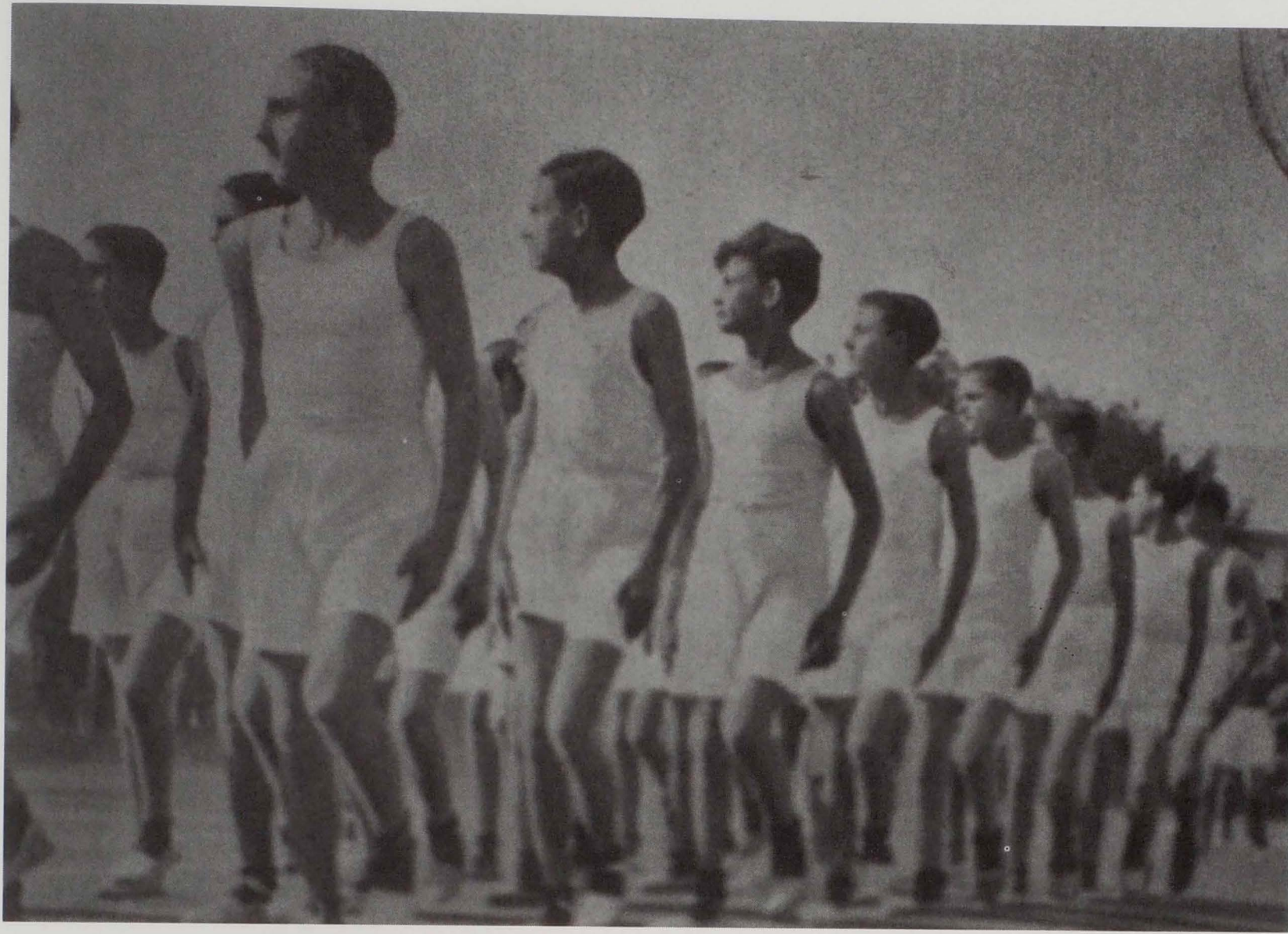
Exercicis gimnàstics dels aprenents de l'escola de l'empresa amb un marcat ambient paramilitar