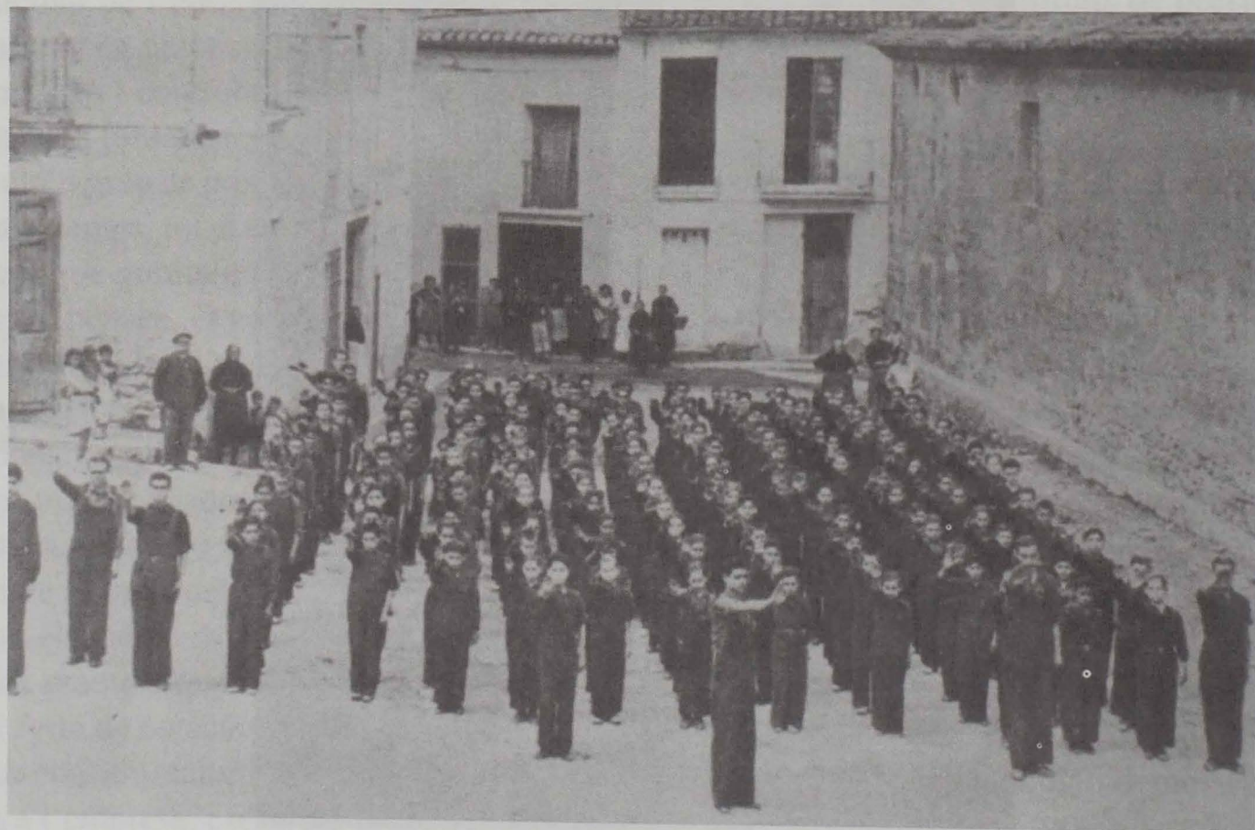
Formació dels aprenents de l'escola de l'empresa a la Vall d'Uixó i cant del «Cara al sol» uniformats i «Prietas las filas»