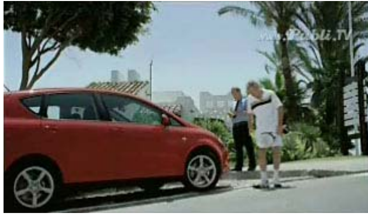
La ira de McEnroe pone en escena y representa el gran carácter del nuevo SEAT Altea.

flamante SEAT Altea fuera del límite de la línea permitida.” En el juego metafórico de la competición, se muestra la ira del que fue gran jugador de tenis.