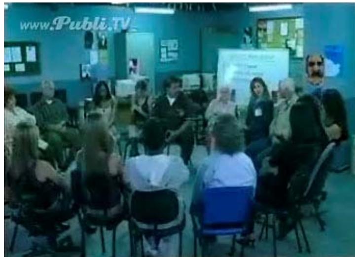
Naomi Campbell dramatiza la ira que siente porque su gusto le lleve a ponerse un vestido barato.

Este sentimiento de descontento hacia algo o hacia alguien, a veces se utiliza para romper o destrozarse algo de la competencia. La ira se pone al servicio de la expresión y connota la gran relación de belleza, calidad y precio en los productos Cherokee.