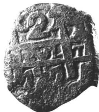
Figura 7. Moneda macuquina (Potosí - 1757).