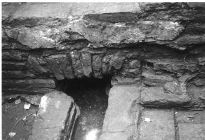
Figura 2: Estructura registrada en el recinto 2, conformaba por muro, canal, dintel y piso de ladrillos de origen jesuita. En el muro, sobre el dintel, se conservan restos de pintura de color rojo.

Hemos mencionado que la mayor cantidad de monedas (ocho de un total de diez), fueron recuperadas en un recinto en el que se registró la presencia de un canal de origen jesuita (fig.2). Al respecto, podemos mencionar que en la Estancia se realizaron distintas actividades para las que era esencial el abastecimiento de agua. Tomemos como ejemplo la oficina de curtiduría. En la Estancia se elaboraban, entre otros productos, suelas destinadas al mercado interno y al potosino (Robledo, 1995). Para curtir se necesitan estanques (noques) en los que se colocan los cueros en agua, vainas y corteza de un árbol que crece abundantemente en el pedemonte tucumano y en la selva de montaña, el cebil. La presencia de estos noques está documentada para la Estancia, y cuando los dominicos ocupan la misma, los documentos mencionan su mal estado: "...y pasando la oficina de curtidurías de suelas se encontró solo el sitio y en el seis noques donde la curtían, todos maltratados por hallarse sin ningún techo..." (A.H.T. Sección Judicial. Serie A. Caja 30. Expte. 25). Por lo tanto, existe la posibilidad de que el canal registrado en el recinto pueda estar relacionado con estos noques o piletas de mampostería asociados a la curtiembre.