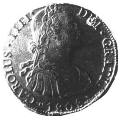
Figura 4. Moneda de busto (Potosí - 1808)

En el nivel 6, se recuperó la moneda de busto de 8 reales con fecha de acuñación más reciente: 1808 (fig. 4). En el nivel 7, se hallaron cuatro monedas: una macuquina de 2 reales de 1731 acuñada en Lima (fig. 5) y tres monedas de busto, una de 2 reales de 1788 (fig. 6), una de 1 real con fecha de 1791 y la moneda restante de 2 reales. En esta última, la fecha de acuñación es ilegible, pero a partir del análisis de las improntas (por ejemplo: leyenda perimetral, la sigla del ensayador y el monograma de la ceca), nos acercamos al período en que esta moneda fue acuñada en Potosí: entre 1795 y 1802. En el nivel 8, se registró la macuquina restante de 2 reales con fecha de 1757 acuñada en Potosí (fig. 7) y dos monedas de busto: una de 2 reales con fecha de 1791 y la restante de 1 real, con fecha ilegible (18..). Se procedió al análisis de las improntas, determinándose su origen potosino y su acuñación entre los años 1800 y 1802.