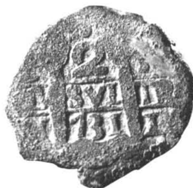
Figura 5. Moneda macuquina (Lima - 1731)