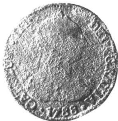
Figura 6. Moneda de busto (Potosí - 1788).