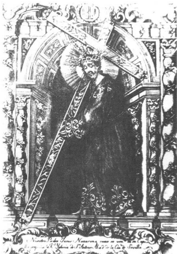
Lámina 3. Grabado que representa el retablo del Cristo de "El Silencio". Siglo XVIII. Hermandad de "El Silencio".