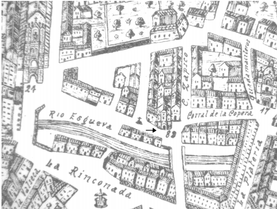
Figura 1. Plano de Valladolid. Ventura Seco. 1738.

Consecuencia de ello por Real Orden de 8 de julio de 1868, la mejora de esta zona de la población se declararía “de utilidad pública para los efectos de la Ley de 17 de julio de 1836” 75 .