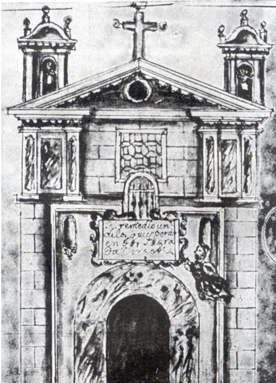
Figura 3. Iglesia de Nuestra Señora del Val y San Eloy. Ventura Pérez. Segunda mitad del siglo XVIII.