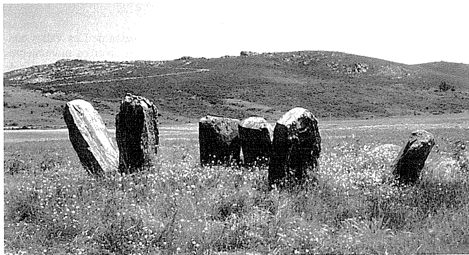
LÁM. II.- Imagen tradicional del dolmen de San Adrián (Granucillo de Vidriales)