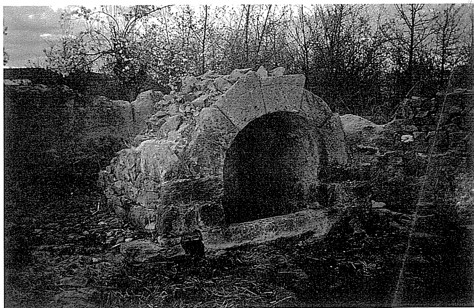
LÁM. VII.- Fuente de San Pedro de la Viña.