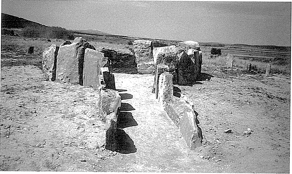
LÁM. IV.- Aspecto actual del dolmen de Arrabalde

Llevaría el mismo planteamiento que el dolmen anterior, reponiendo alguno de los ostostatos, de los que se conservan cinco originales, a fin de completar la cámara y el pasillo de acceso. (lám. IV)