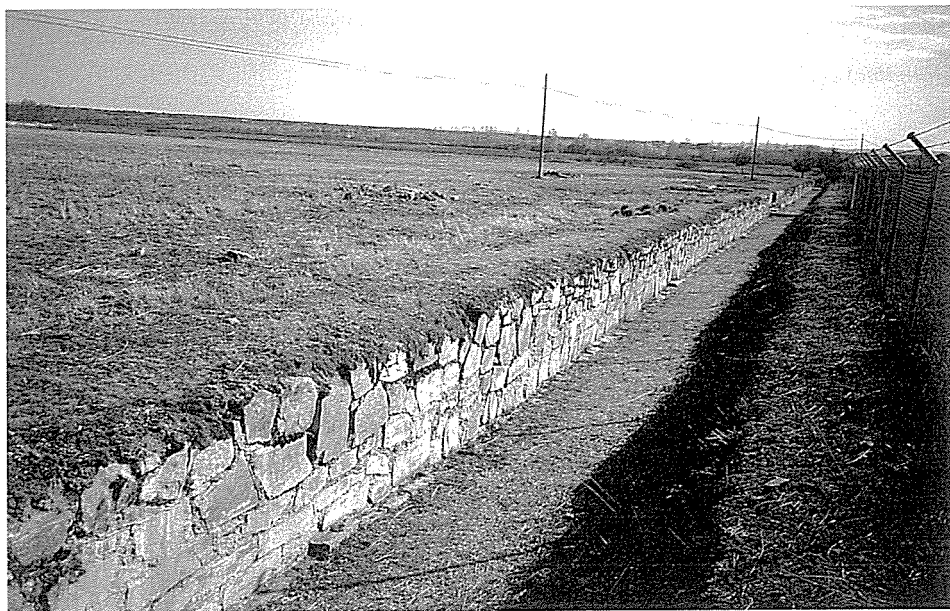
LÁM. VI.- Muralla campamental de Petavonium (Rosinos de Vidriales)