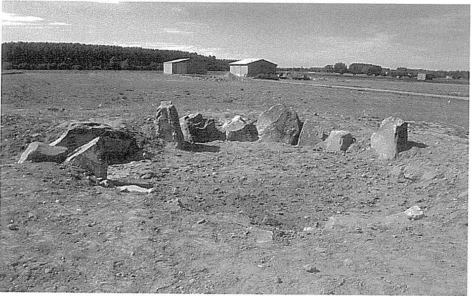
LÁM. I.- Dolmen del Tesoro (Morales de Rey)

Al lado de este monumento original, se va a recrear un dolmen entero, con las cubiertas de cámara y corredor y el túmulo de tierra situado encima, al que tendrán acceso los visitantes, permitiendo así hacerse idea exacta de lo que supone este tipo de arquitectura funeraria.