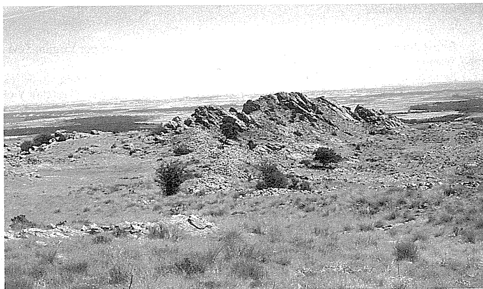
LÁM. V.- Castro de Las Labradas (Arrabalde)