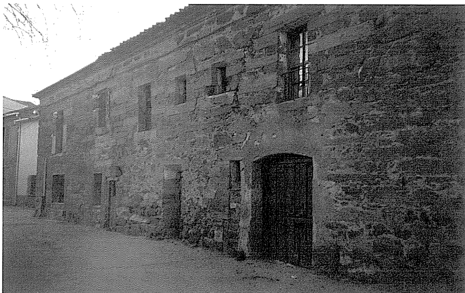
LÁM. IV.- Fachada Suroeste del Convento

Perteneciente a este documento y como anexo y ampliación en las cláusulas de las que consta, se extrae otro documento, en el que se cita, que los monjes Jerónimos se van del Monasterio y se hace entrega a los monjes Dominicos del mismo, por parte de los marqueses, el cual por motivos de espacio no ha podido ser abordado en este número.