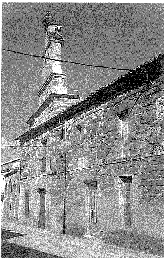
LÁM. I.- Fachada principal del Convento de María de Jesús