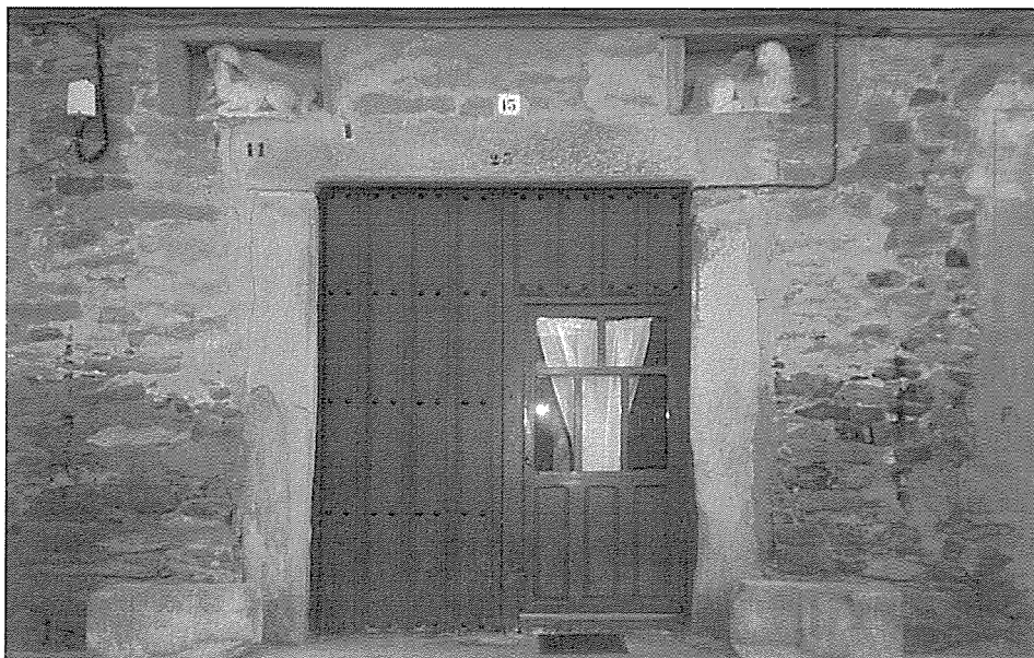
LÁM. III.- Fachada del Colegio

En las cláusulas en que los Marqueses otorgan los diferentes bienes a la orden de los Jerónimos aparecen siete apartados, donde se detalla las tierras que se le entregan, los ganados, el dinero en metálico, así como las obras que se realizaron, tales como la construcción de un pasadizo para poder acceder desde el Monasterio al Colegio sin tener que pisar la calle. Dentro del séptimo apartado tenemos tres párrafos que hacen referencia al Colegio, que los propios Marqueses patrocinaron.