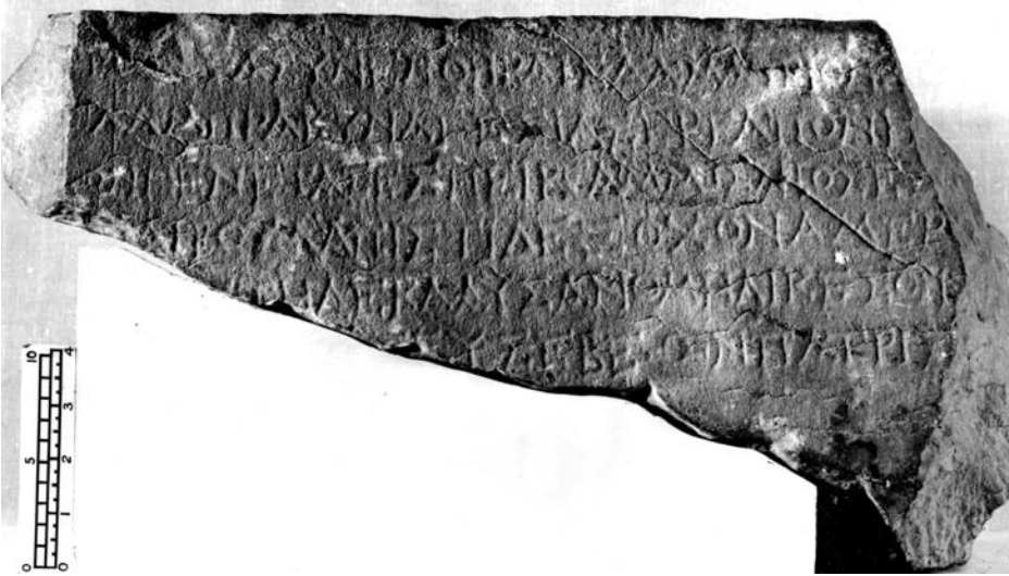
Figura 3. Fotografía del Fitzwilliam Museum (Negative No.: FMS.25).