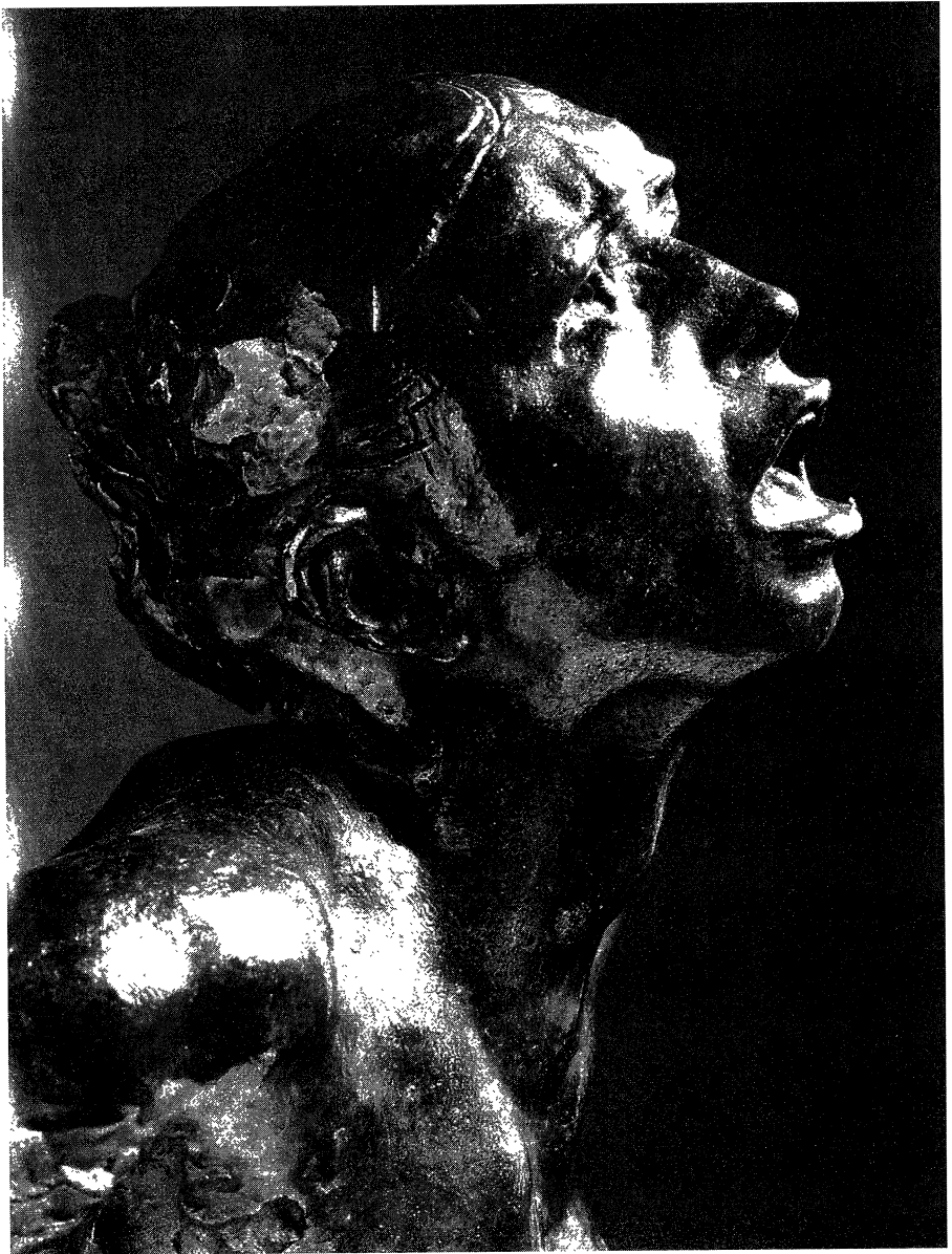
O grito , Rodin. 1899. Expresión de dor da vítima..