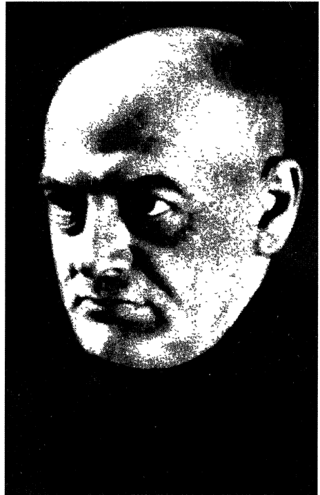
Max Scheler Diccionario de autores Bompiani , Ed Planeta-Agostini, 1987

Coas orientacións e ablucións cristiás introducidas por Hildebrand ("Die Idee er sittlichen Handlung", 1916), e as seguridades platónicas engadidas por N. Hartmann (1882-1950),