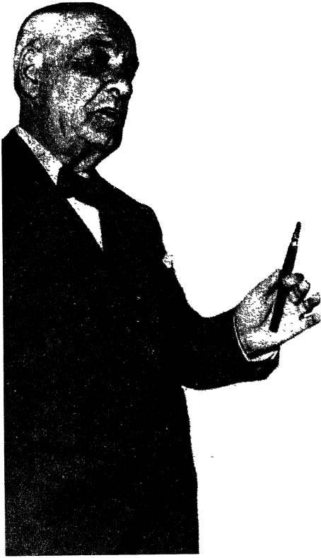
José Ortega y Gasset Diccionario de autores Bompiani , ed Planeta-Agostini, 1987

da terra nova á vista e ollo ás artes milagreiras de cultivo chegan a España, como tantas outras veces, por obra da escoita e vixiante atención coas que Ortega acompañaba os alentos rexeneradores hispanos cada vez que pegaba a orella á terra enxergada de alén dos Pirineos.