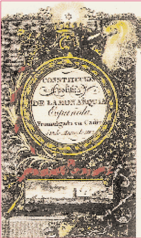
Constitución de 1812: “O plan xeral de ensino será uniforme en todo o Reino”.

Pública”: “O Plan xeral de ensino será uniforme en todo o Reino” (artigo 368); “As Cortes por medio de plans e estatutos especiais, arranxarán canto pertenza ó importante obxecto da instrucción pública” (artigo 370).