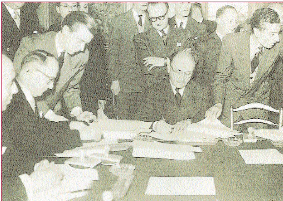
Jean Monnet e o ministro de Exteriores alemán, Hallstein (de perfil), asinan a fundación CECA en 1951. O primeiro paso para a unidade europea deuse no ámbito do mercado do carbón e do aceiro.

separación de poderes e o Estado de dereito; pero téñenos, ademais, porque a competición política democrática entre a esquerda e a dereita estará determinada durante moitos anos en Europa occidental, tamén, pero non só, pola discusión sobre a suposta superioridade do modelo soviético respecto do democrático-burgués, así chamado en tal contexto de debate.