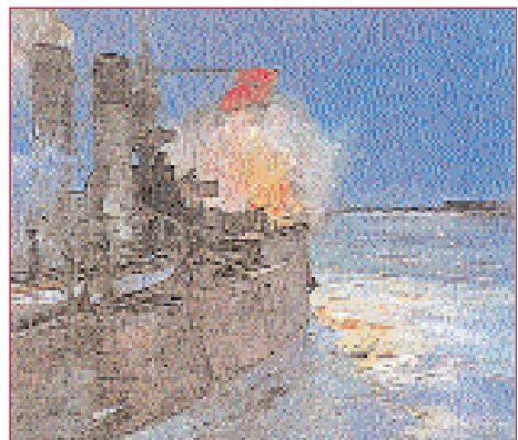
O buque Aurora dispara desde o río Neva sobre Petrogrado.

A da guerra non foi, certamente, a única ruptura que marca o inicio da centuria, pois, de feito, en plena guerra ten lugar a primeira das moitas revolucións de tipo comunista que ían caracterizar case ata o final o seu decurso en todo o mundo: a revolución comunista fundadora , a bolxevique, que triunfa en Rusia en 1917. Dirixidos por un comité revolucionario militar e axudados polos soldados da gornición de