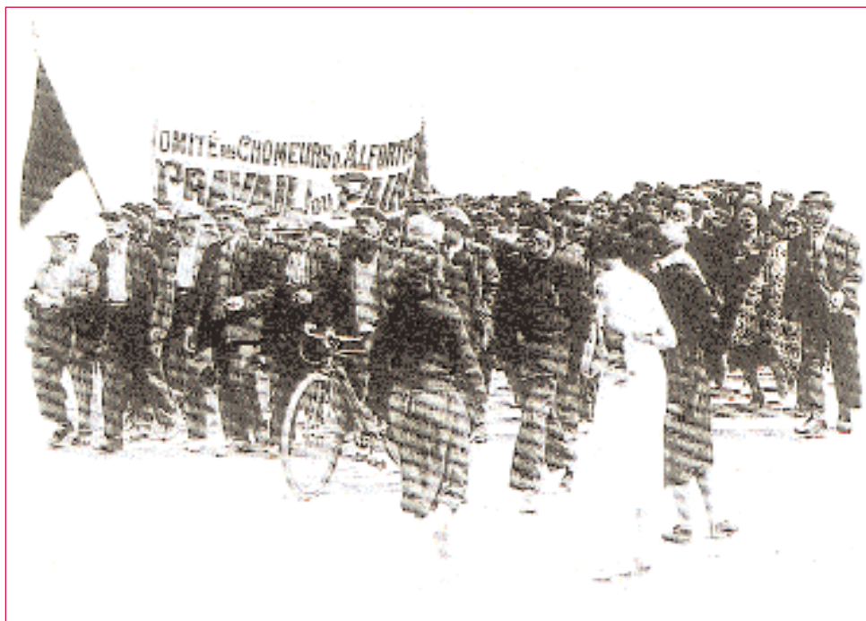
A Gran Depresión en Francia. Os folguistas pedindo traballo ou pan.

diplomática. Foi daquela cando os chamados países capitalistas comprenderon que o comunismo ruso non era unha anécdota na historia, era unha seria ameaza ó modelo occidental.