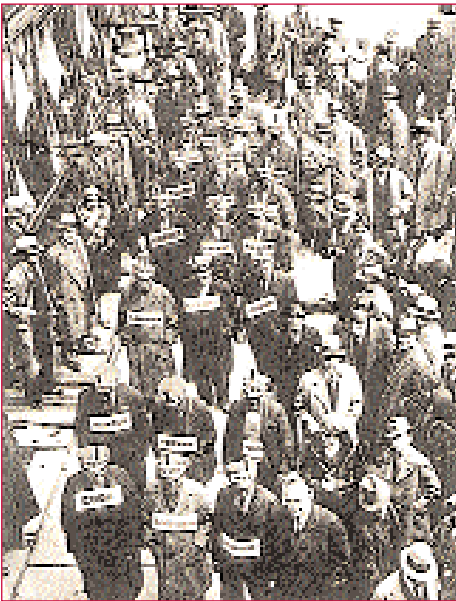
A Gran Depresión nos EUA. Os cidadáns que perderon na Bolsa tanto diñeiro coma o que se gastou na Gran Guerra ofrecen o seu traballo por un dolar á semana.

Ademais destas crises, o propio sistema capitalista experimentou a chamada Gran Depresión, con epicentro no ano 1929, pero cunha maior extensión no tempo que obrigou a reformu-