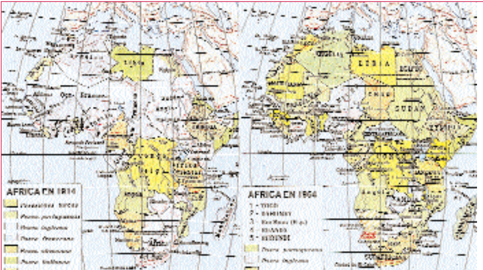
A descolonización trouxo consigo un enxame de novos estados (Tomado de La Tierra . Edit. Salvat).

O investimento directo, é dicir, a adquisición de bens materiais nun país estranxeiro, foi importante mentres foron baixos os custos de man de obra, e iso explica a atracción do IDE por parte de moitos países subdesenvolvidos, o que significou unha importante axuda. Pero hoxe cos avances tecnolóxicos que permiten acurta-los ciclos de produción gracias á maquinaria asistida por ordenador, o baixo custo da man de obra pasou a un segundo lugar á hora de atraer capital estranxeiro.