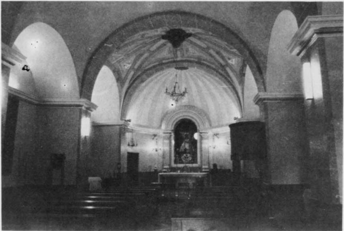
CASAS IBAÑEZ.— Ermita Virgen de la Cabeza. Interior hacia la cabecera.