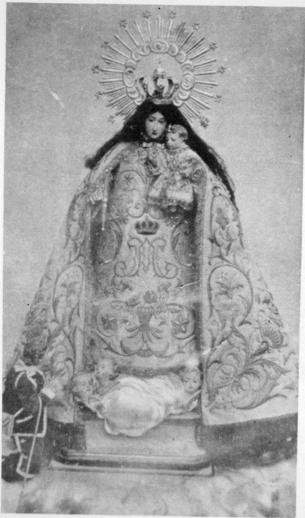
Segunda imagen de la Virgen de la Cabeza. Desapareció en la última guerra civil.