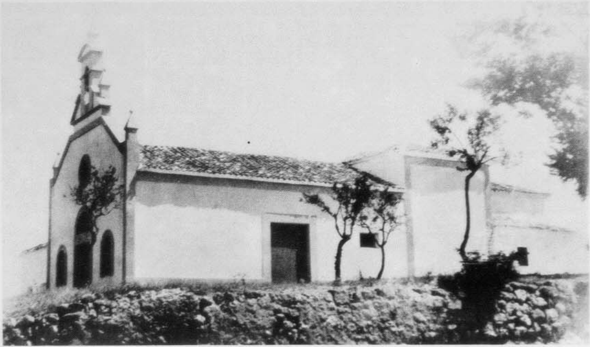
CASAS IBAÑEZ.— Ermita Virgen de la Cabeza. Hacia 1940.