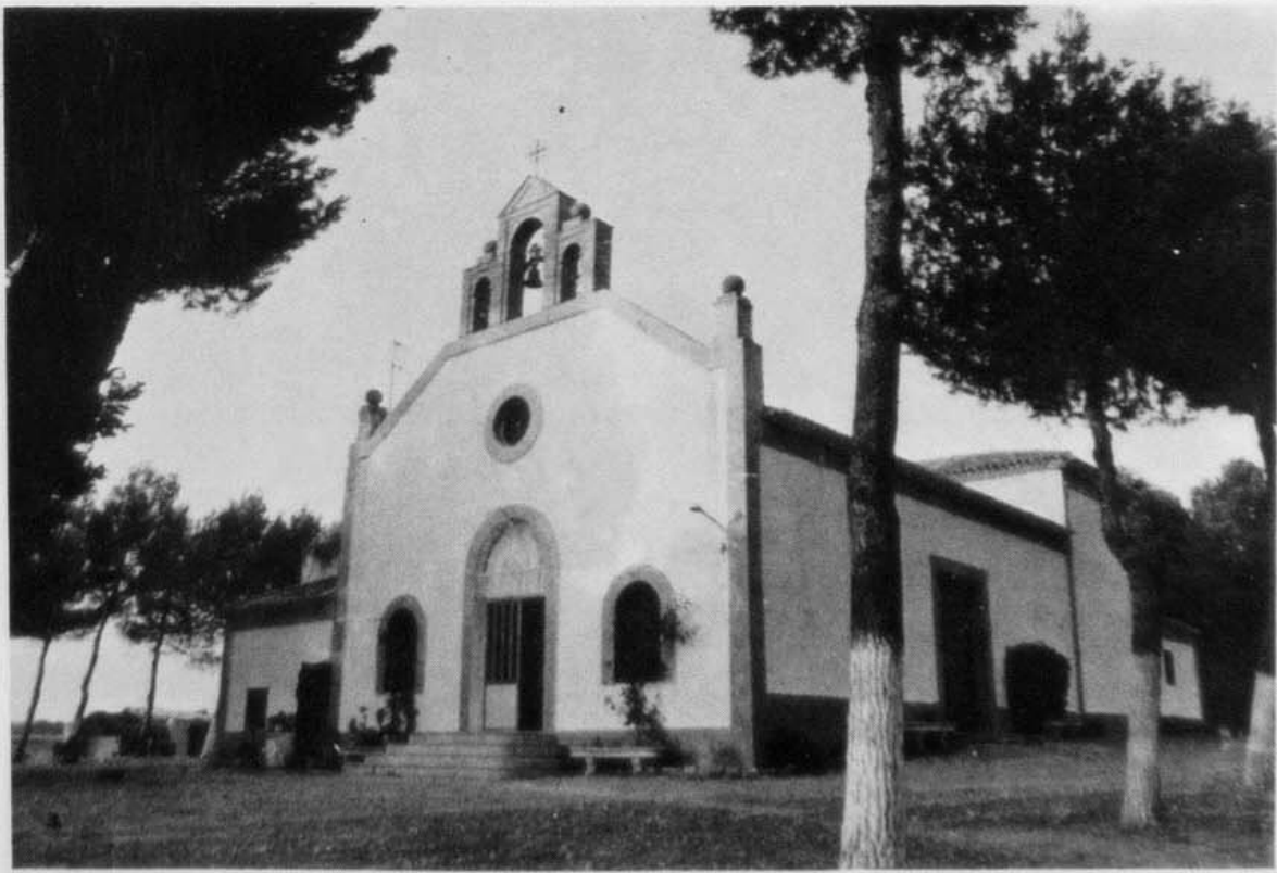
CASAS IBAÑEZ.— Ermita Virgen de la Cabeza. Estado actual.