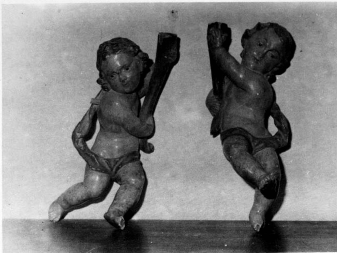
Foto 3. GOLOSALVO (Albacete). Angeles procedentes de las antiguas andas realizadas por Salzillo.