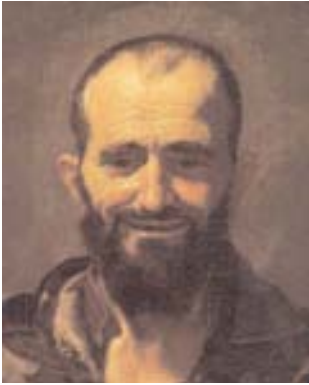
14 Sobre el tema de la relación entre la pintura tenebrista y el teatro puede verse el artículo de Silvia Danesi Squarzina incluido en el catálogo de la exposición que el Museo del Prado dedicó a Caravaggio en 1999: "Pintura y representación: "Caravaggio, valiente imitador del natural" m ".

hubiera saltado a la escena con la única intención de saludar a los espectadores y salir en la foto. Su aspecto recuerda un poco a la imagen socarrona de Demócrito , aunque también podríamos emparentarlo con alguno de los personajes que aparecen en el Sileno ebrio del Museo di Capodimonte, realizado en la misma época que Los borrachos de Velázquez.