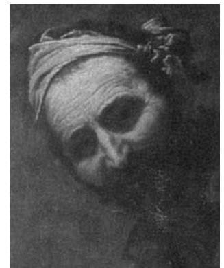
13 El barroco , Xarait, Bilbao, 1986, pp. 129 ss.