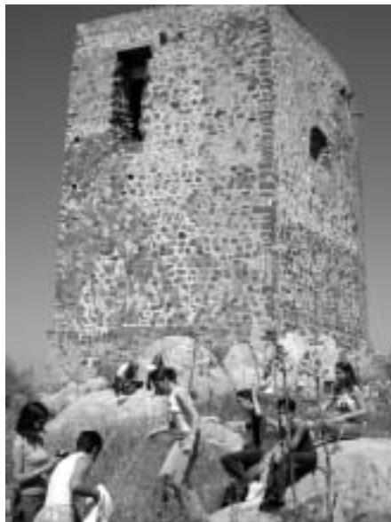
Visita del Lycee Bellevue al Castillo de Belmez.

castillete mineros en los que se observa la evolución de estos, con el tiempo.