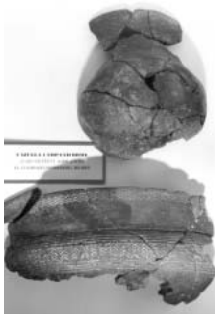
Cazuela campaniforme. Calcolítico. El cuadrado. Fresnedoso. Belmez.

c) Los tres últimos dígitos representan el número de orden del catálogo correspondiente, que viene indicado por una letra ( que antecede a estos tres dígitos) que hace referencia a: