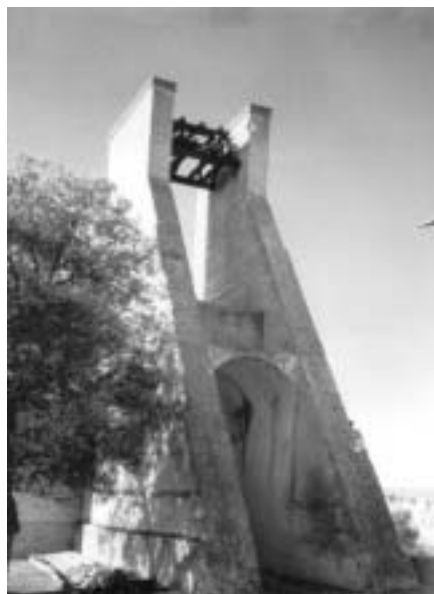
Castillete mina "Lucas Mallada".