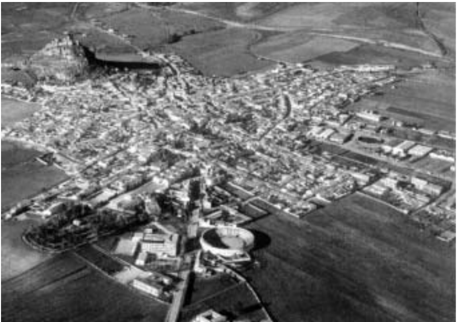
Vista aérea de Belmez.

Museísticos de la Comunidad Autónoma de Andalucía (Decreto 284/1995 de 28 de noviembre). La denominación del mismo, responde a que desde un principio, no solo se ha querido en convertirlo en un lugar de exposición, sino que además su acción abarque todo el ámbito de interés cultural y patrimonial, que durante el