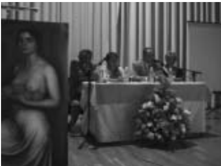
Acto de presentación de la conferencia "Julio Romero de Torres".

Directora del Museo de Bellas Artes de Córdoba.