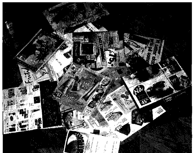
Se usan los más diversos productos de comunicación

En los años recientes, las agencias de publicidad han perdido el monopolio que antes ejercían en el diseño y desarrollo de las estrategias comunicativas de los anunciantes. El prestigio y la reputación de cualquier marca u organización hoy dependen