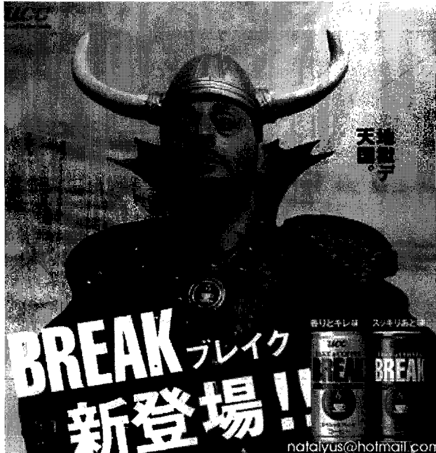
Personajes que se identifican con las marcas

eficiente gestión comunicativa, destinada a contribuir positivamente a la transformación cultural de un gran corporativo de las telecomunicaciones (Telmex), venciendo la resistencia de un sindicato que oponía firme resistencia a toda iniciativa de modernización.