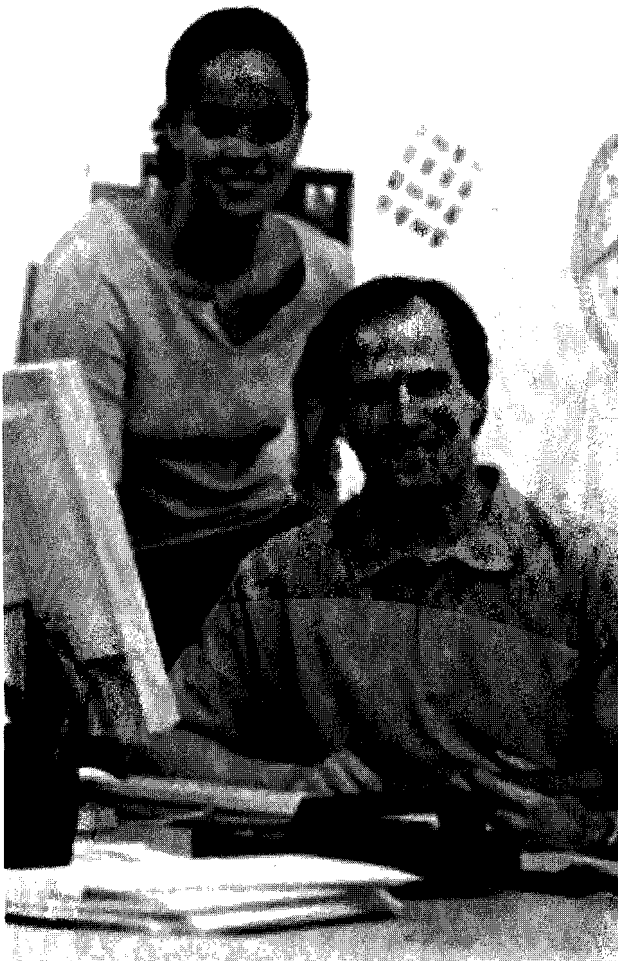
Nuevos roles comunicativos

Algunos gobiernos inclusive contratan los servicios de firmas especializadas en cabildeo. Para concretar la firma del Tratado de Libre Comercio (TLC) entre los gobiernos de Canadá, los Estados Unidos y México, por ejemplo, Carlos Salinas de Gortari (1988-1994), entonces presidente de México, contrató los servicios de las agencias Public Strategies, Burson Marsteller, y Shearman y Sterling, las cuales se encargaron de persuadir a aquellos legisladores del Partido Demócrata que no tenían interés alguno en aprobar el Tratado de Libre Comercio.