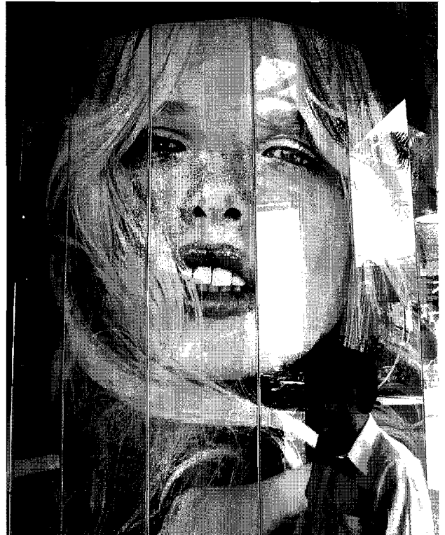
La imagen lo es todo

En México, por razones históricas muy profundas, la práctica del cabildeo admite una inevitable asociación con el fenómeno del influyentismo . En los tiempos de la presidencia imperial (1929-2000), el influyentismo fue uno de los signos distintivos de los gobiernos emanados del Partido Revolucionario Institucional (PRI), el cual gobernó ininterrumpidamente en México de 1929 al 2000. Al amparo del influyentismo proliferaron la corrupción y el nepotismo. El influyentismo además degeneró en patrimonialismo . Frecuentemente, los funcionarios de dependencias gubernamentales dispusieron de los bienes públicos como si éstos fuesen de su propiedad. Por medio de complejas negociaciones que frecuentemente se realizaban al margen de lo establecido en la ley, los influyentes procuraban satisfacer las peticiones y favores que solicitaban sus protegidos. Todo cacique, simultáneamente, desempeñaba las funciones de gestor y negociador. Del eficiente desempeño del cacique y de sus estrechas relaciones con las autoridades, en buena medida, dependía el efectivo incremento de sus cuotas de poder.