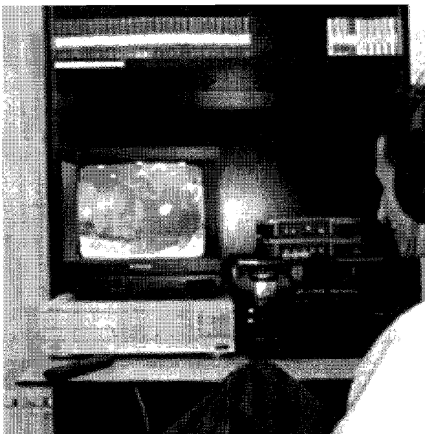
Universo mediático regulado

Por otra parte, la aplicación de la ley estará en manos de órganos dependientes del poder ejecutivo. Esto, en cualquier contexto resultaría preocupante, pero lo es más en el venezolano debido a la excesiva polarización del debate político (que arropa también a los medios), a lo que se suma la ausencia de fronteras claras en la ley para determinar causales de sanciones en materia de violencia