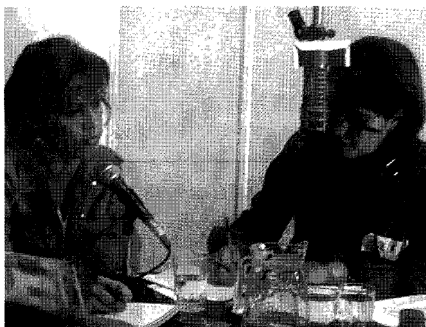
Responsabilidad social de radio y televisión

Se trata de una ley concebida como una retaliación política contra los medios privados. En la agudización de la crisis política venezolana, a partir de diciembre de 2001 y de forma especial en los puntos más álgidos de dicho proceso, se hizo evidente una alineación política de los más emblemáticos medios