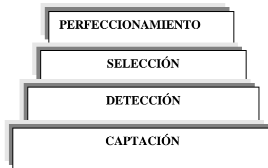
Figura 3. Perspectiva organizativa del proceso de selección deportiva.

Dentro de las cuestiones que consideramos vitales al analizar estas aspiraciones y que pueden ser interpretadas como perspectivas de trabajo futuro, se encuentra la creación de modelos de detección del talento deportivo y ello, como se puede entender coadyuva a una transformación de índole organizativa al insertar una fase, hasta el momento inexistente, y que se interpondría entre la captación y la selección del talento deportivo, llamándose detección a esta nueva fase, de esta manera quedaría el proceso, expresado gráficamente de la siguiente manera.