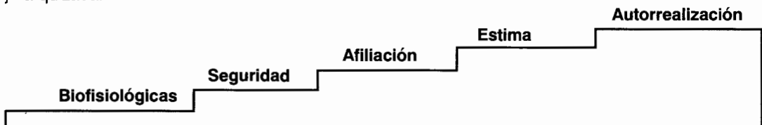
Jerarquización de necesidades humanas según Maslow (1975)

Maslow distingue dos categorías de necesidades: básicas e idiosincrásicas. Ambas son naturales, puesto que surgen de la naturaleza, las primeras de la específica y las segundas de la individualizada. Defiende que las básicas son también las superiores o meta-necesidades, puesto que el hombre aparte de las necesidades fisiológicas, tiene necesidad de seguridad, de afectividad...; pero también de libertad, de justicia... En una palabra, de dar sentido a su vida, de autorrealizarse. Junto a Erikson, conviene que estas necesidades básicas son compartidas por todos los hombres y se mantiene a lo largo de su vida, y al igual que las crisis pueden encontrarse en estado potencial o actual, activas o inactivas. Pero la aportación más característica de Maslow es determinar que las necesidades no aparecen todas al mismo tiempo, ni con la misma urgencia; se presentan de forma evolutiva, jerarquizada.