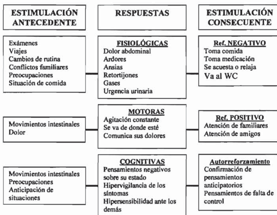
Figura 1.- Esquema de la hipótesis de análisis funcional de mantenimiento del problema del caso clínico

10-15 minutos), aunque es la comida habitual de la familia. Por la noche suele cenar fuera (pizza, camperos, bocadillos), y cuando lo hace en casa también es muy rápido (15 minutos). En la Figura 1 aparece la línea base sobre la frecuencia, intensidad y duración de los episodios de dolor, obtenidos durante dos semanas. Aparecen numerosos episodios de dolor y molestias gástricas (movimientos intestinales, ardor, ganas de vomitar, etc.) que suelen durar entre 30 minutos y una hora. Casi todos ellos aparecen relacionados con situaciones de ansiedad, disgustos o discusiones, o anticipadamente a situaciones estresantes.