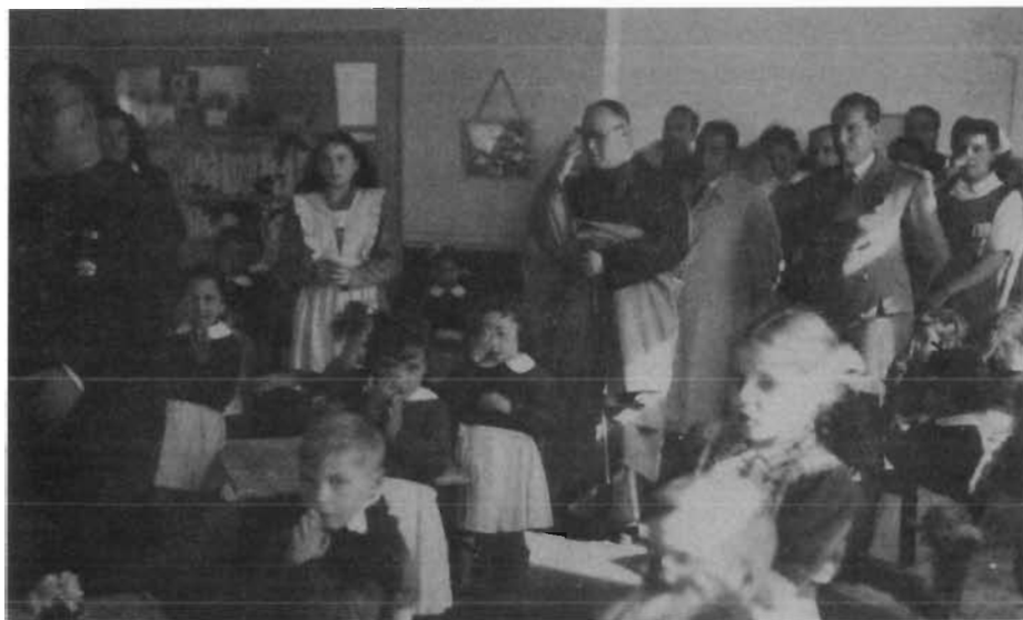
Foto 6 Visita de autoridades al Jardín Maternal de Zamora. Ca. 1942-1943.