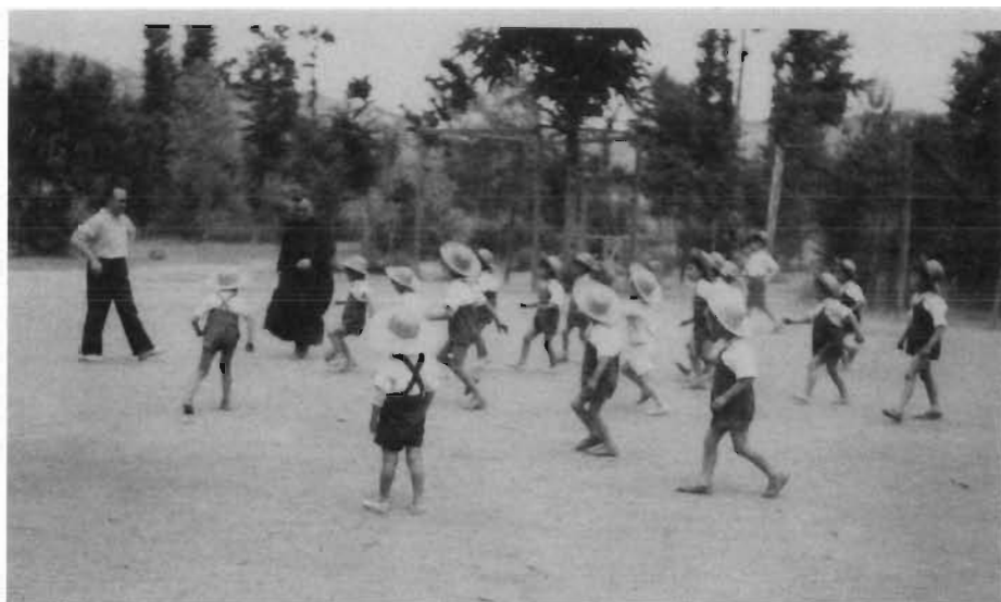
Foto 5 Jornada en el Bosque de Valorio de los niños del Jardín Maternal de Zamora. Ca. 1942-1943.