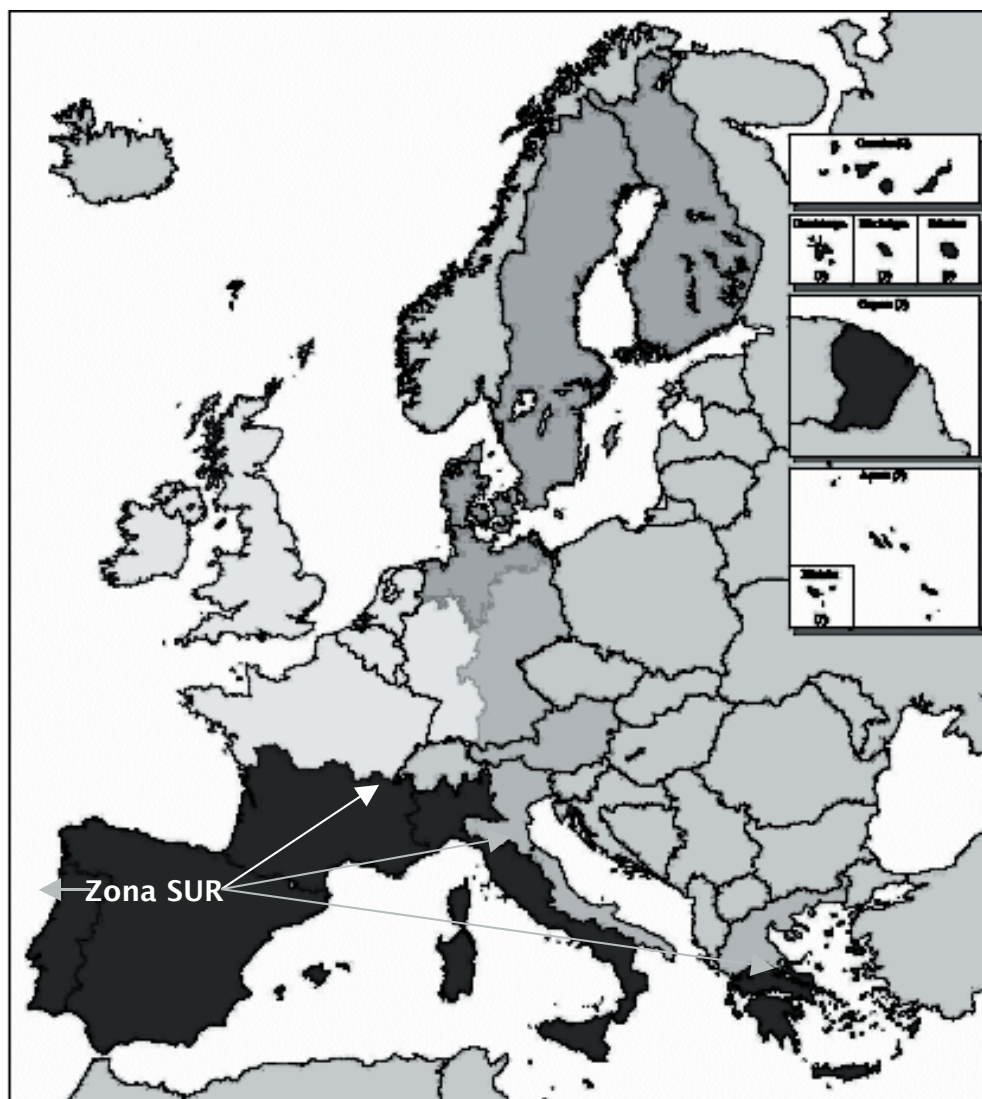
Figura 3: Programas INTERREG III C