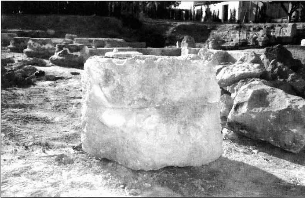
FIGURAS 4 Y 5. Aspecto de las otras caras del elemento.