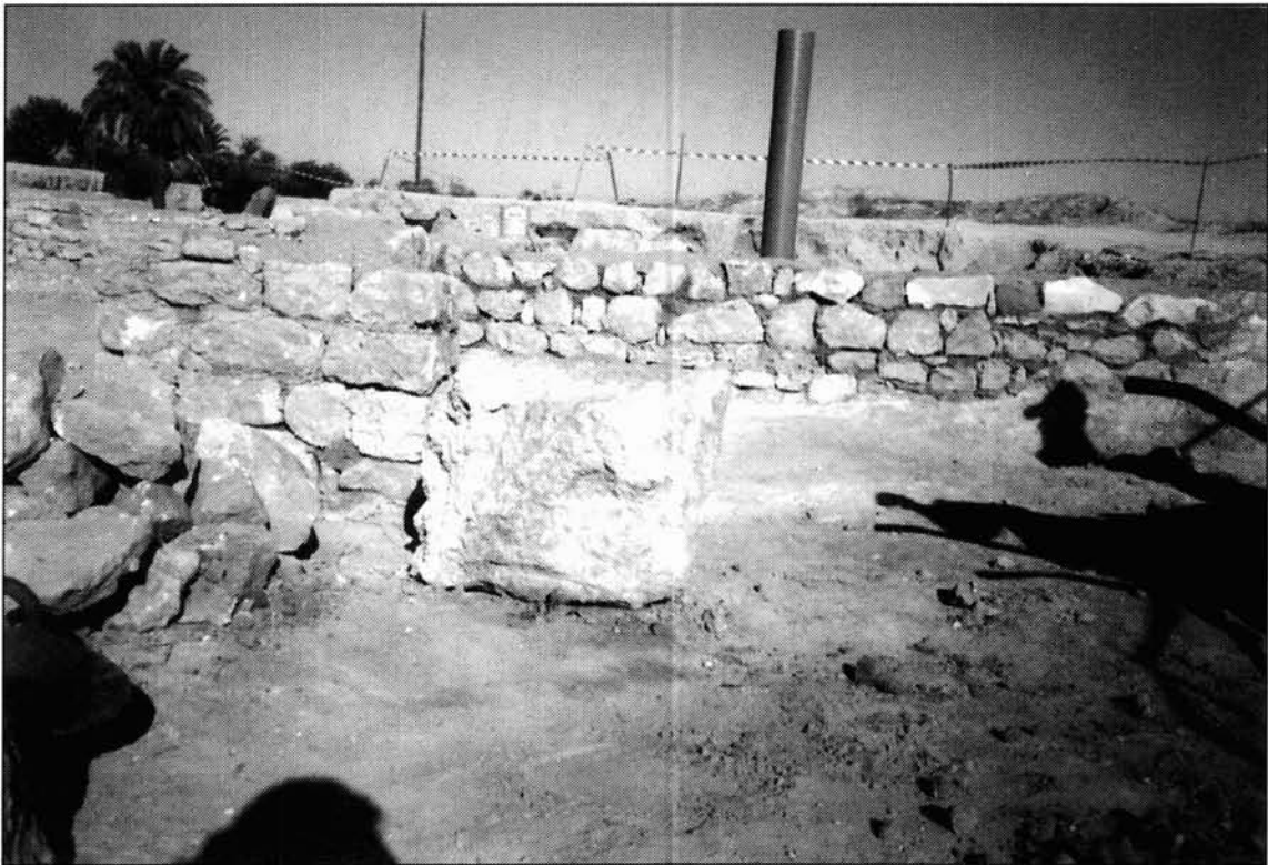
FIGURA 3. Contexto de la excavación en que fue hallado el relieve.