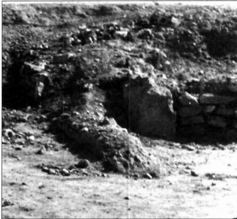
FIGURA 6. El sillar reutilizado en uno de los muros de la domus del sector 5-F, en el proceso de excavación.