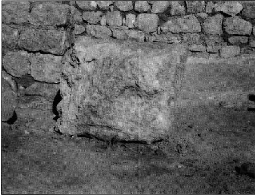
FIGURA 2. Vista frontal del relieve.