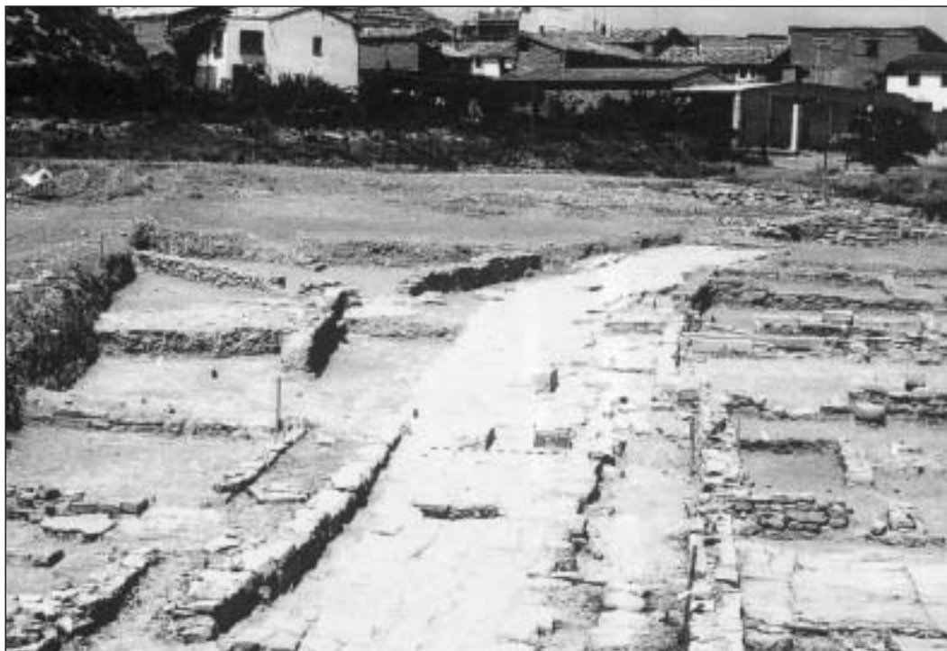
Foto 1. Cara de Cumanos