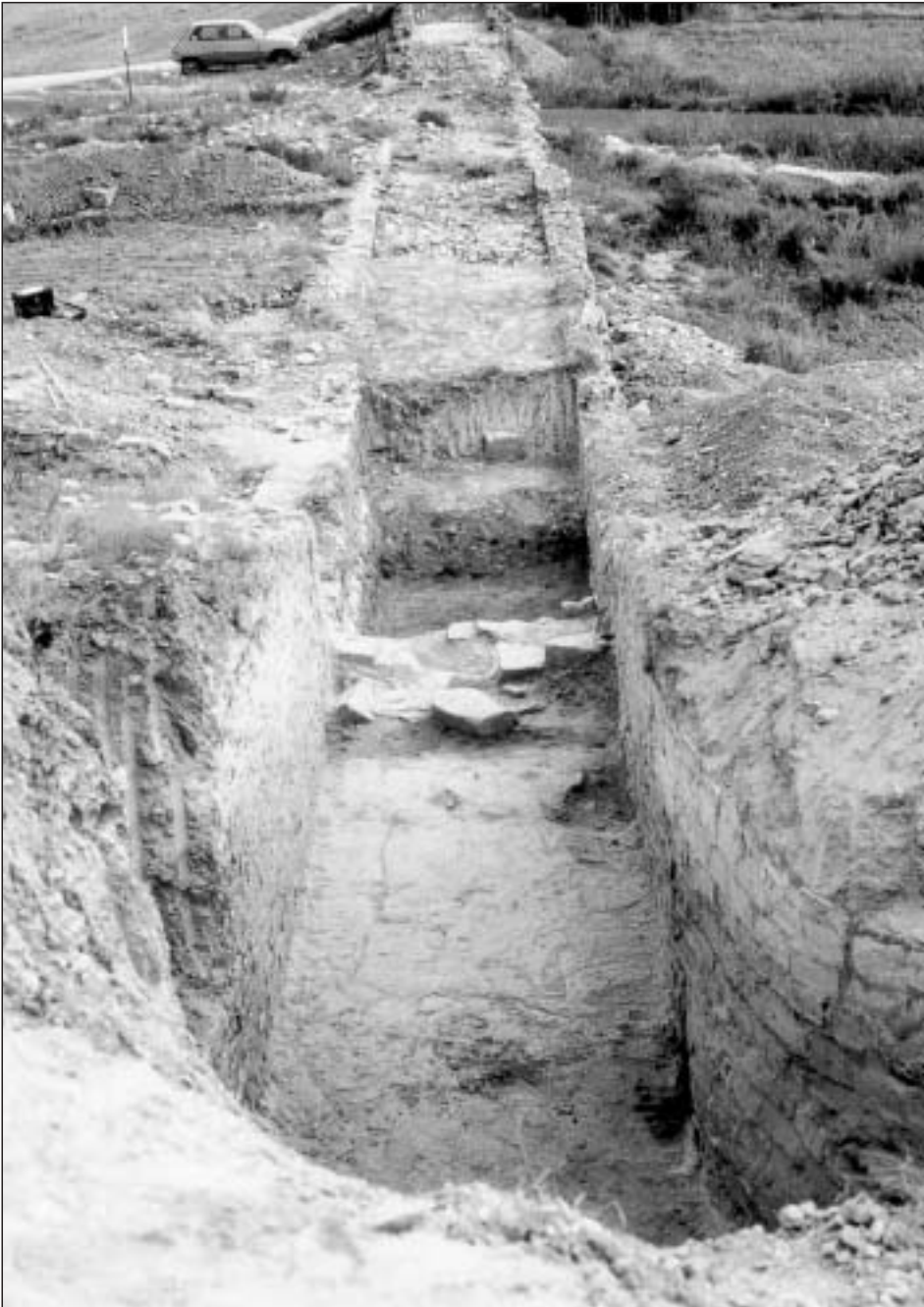
Foto 4. Lodosa. Canal romano