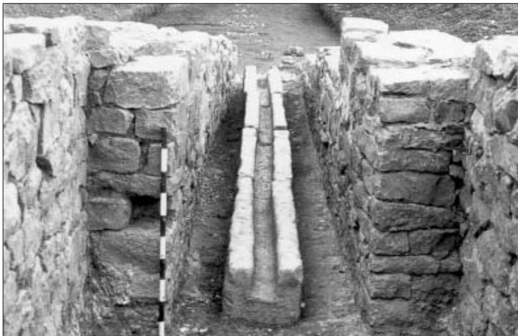
Foto 2. Andelos. Depósito regulador. Salida del acueducto