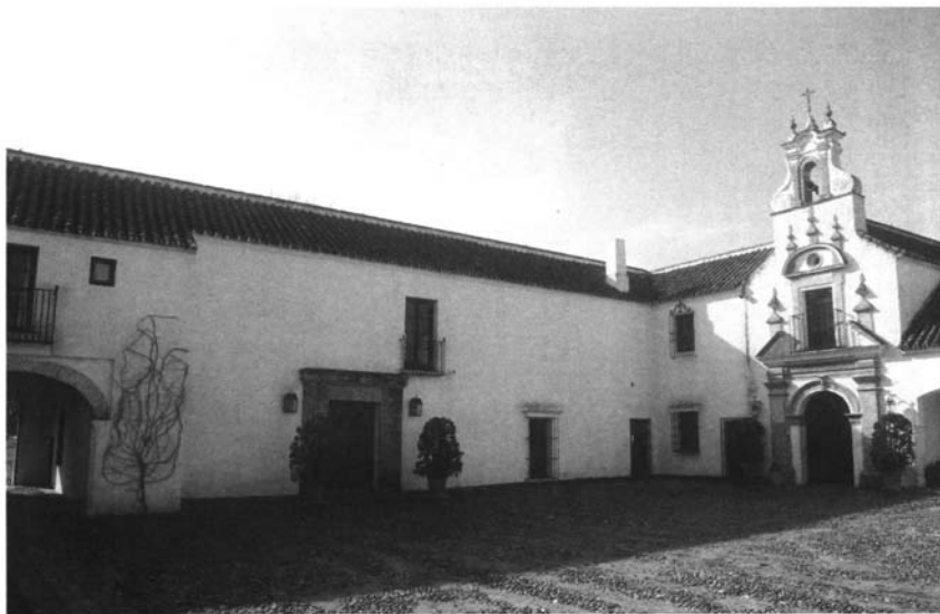
Lám. 5. Señorío y capilla.