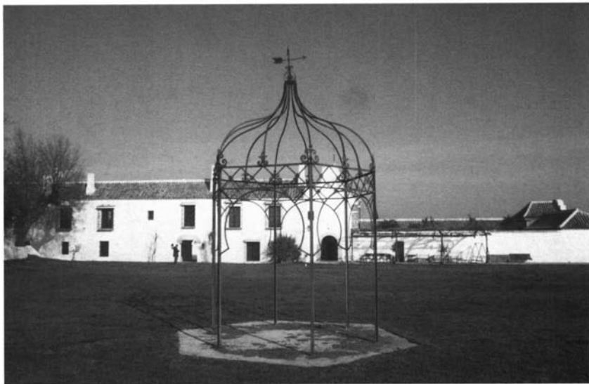
Lám. 10. Antigua huerta, hoy jardín, de Vistahermosa