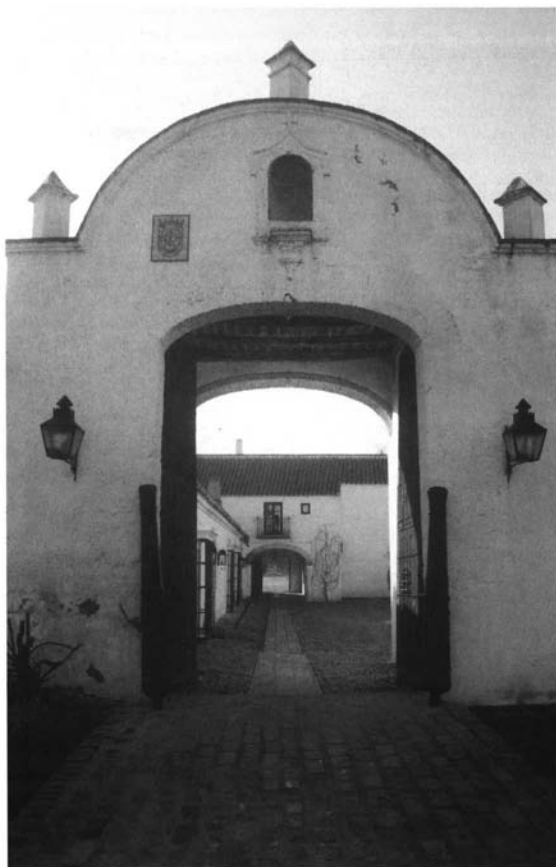
Lám. 3. Portada de la hacienda