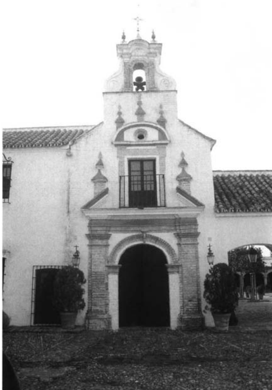
Lám. 7. Portada de la capilla