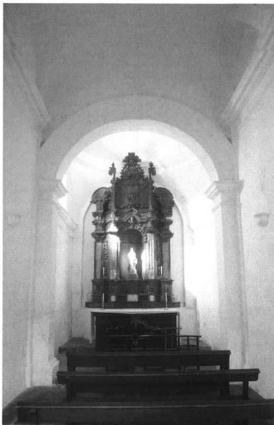
Lám. 8. Cabecera de la capilla