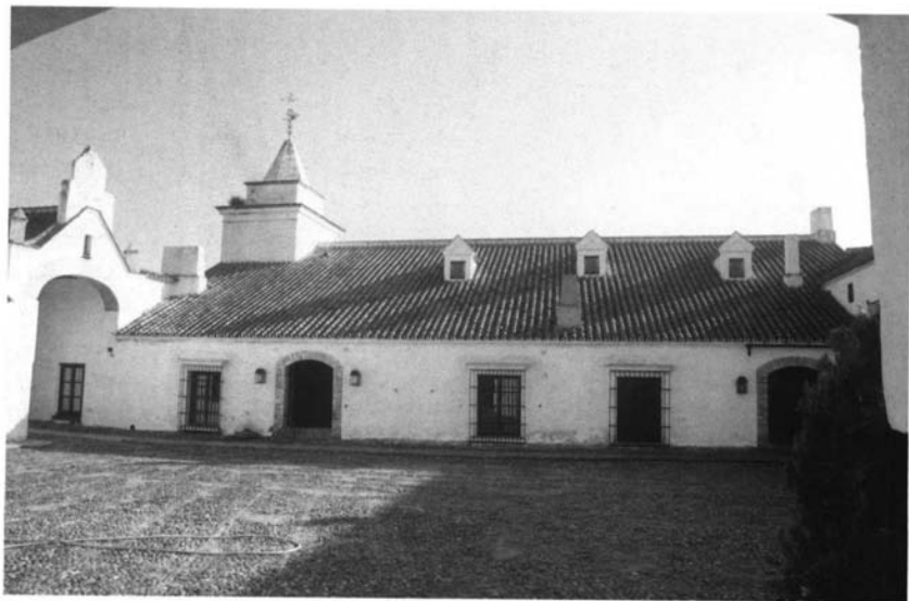
Lám. 4. Almazara