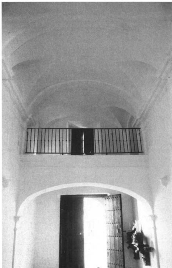
Lám. 9. Tribuna de la capilla