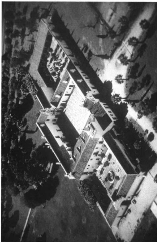
Lám. 2. Vista aérea de Vistahermosa