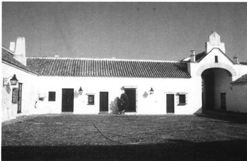
Lám. 6. Interior de la crujía de fachada