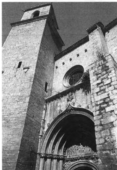
Estado actual del lado oeste (f. M. a I. Sepúlveda).