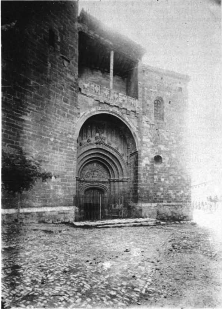
Imagen retrospectiva del costado occidental de la colegiata de Daroca.