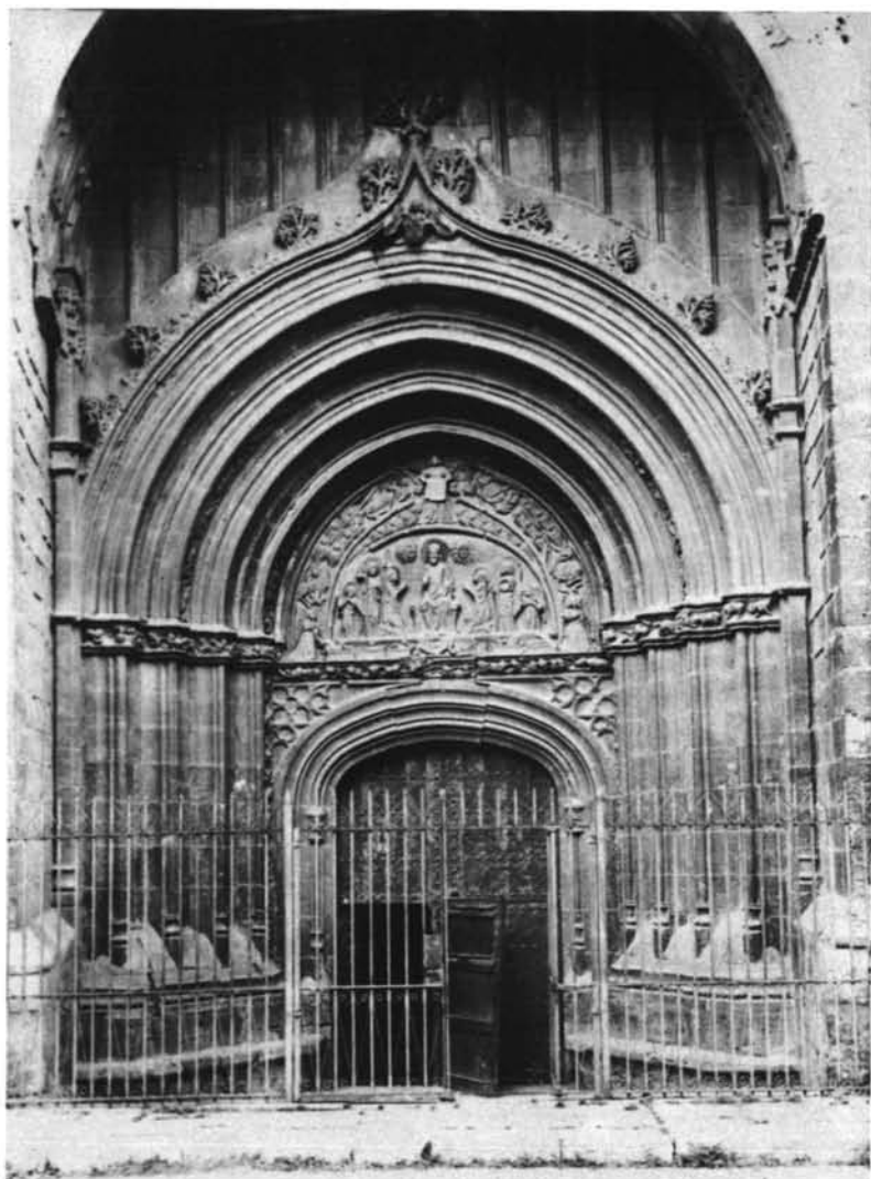
Portada del Perdón: conjunto.