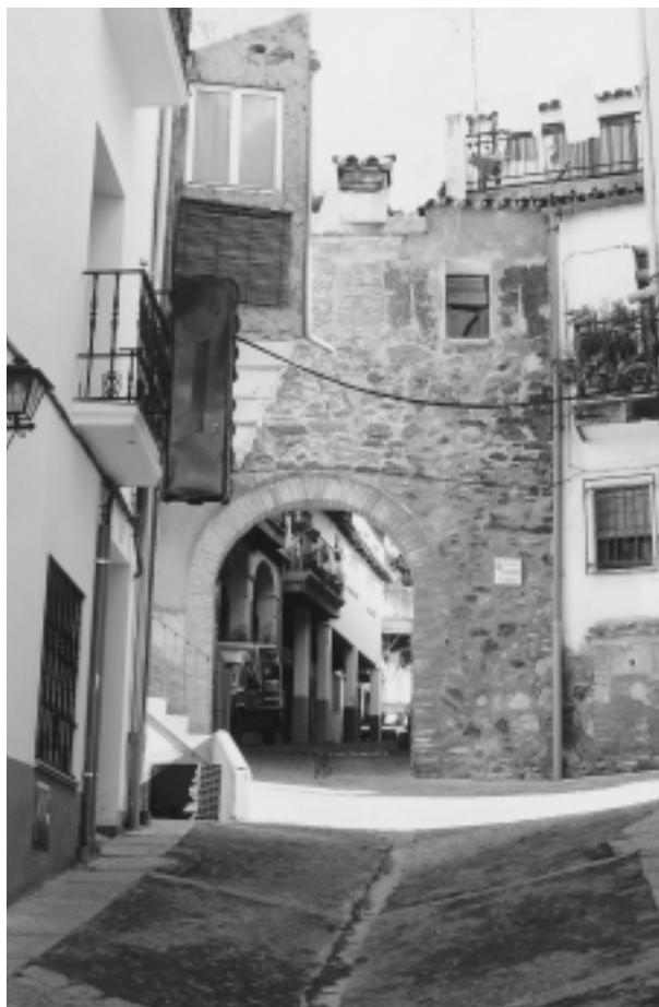
FIG. 1. Barrera de Perálvarez.

otra calle por el mismo lado hasta la puerta de las Eras. Se cita también aquí, además de la calle de san Bartolomé y la de los Caldereros, la calle o barrio de la Corte 27 . El hospital de San Bartolomé parece que estaba fuera del recinto pues se indica «casas que ay desde el ospital de san bartolme subiendo por mano derecha hasta la barrera del rrealejo...» 28 .