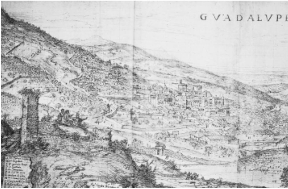
FIG. 4. Dibujo de Anton Van den Wyngaerde, 1567. (Österreichische Nationalbibliothek, Viena).

también era del monasterio pues la había comprado a Pedro Rodríguez de Toro en 1526 49 . Todavía se conserva la calle de Toro y otras que aparecen en estos documentos, como calle Cantera y Altozanillo.