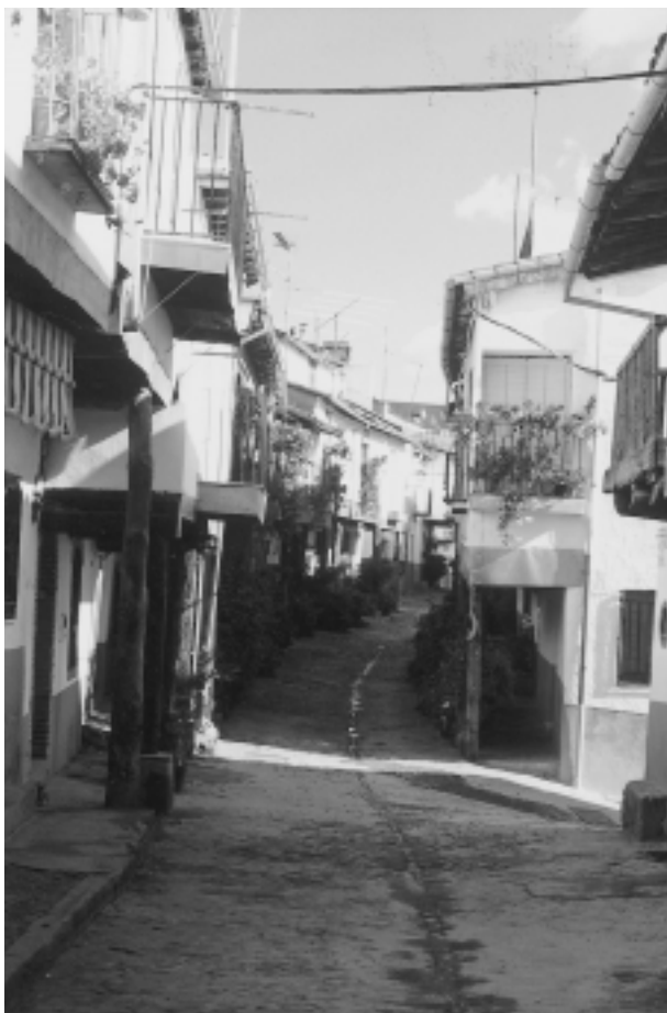
FIG. 2. Calle de las Eras.

Otra fuente documental diferente nos hace pensar que el citado arco de la Barrera de las Eras fue abierto a finales de los años treinta del siglo XVI, y con ello la misma calle de las Eras, pues en el Capítulo celebrado el 1 de junio de 1537 se acuerda hacer una calle para salir a las eras desde la Plaza, sobre todo para la mejor circulación de carruajes: «... y ansi mesmo su R a de nro. p e . propuso como avia neçesidad de hazer una calle por salir a las eras de la plaça porq. la gente q. viene a la fiesta de nra. Señora de setiembre tenga mas lugar para entrar y salir y porq. se haga para las carretas camyno llano a esto el convento respondió q. le pareçia bien y q. se hiziese yendo primero algunas personas a verlo » 29 .