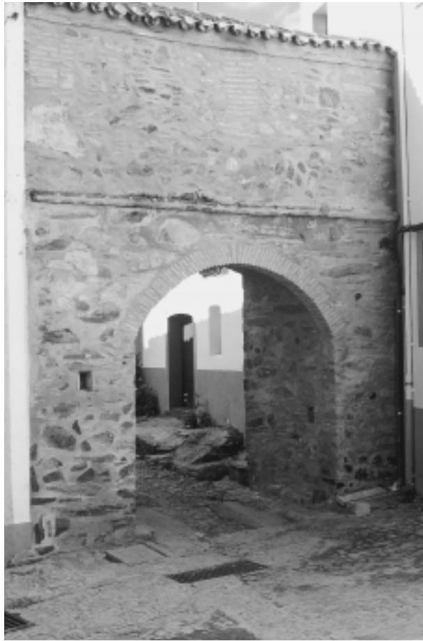
FIG. 3. Puerta de las Eras.

desde cualquier otro lado del Barrio de Abajo, que no fuera éste, debía superar fuertes pendientes, como puede contemplarse todavía.