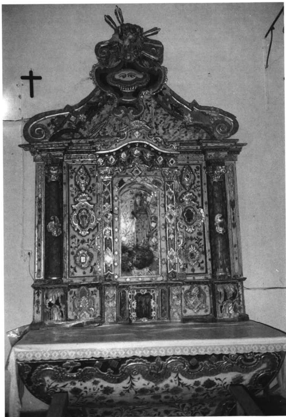
Foto 3. Retablo de Santa Lucía.