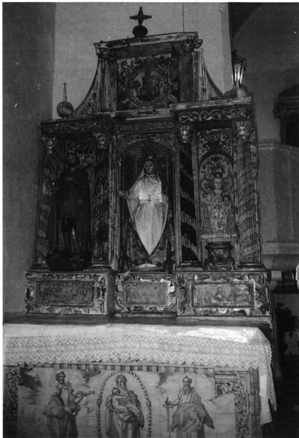
Foto 6. Retablo de Ntra. Sra. del Rosario.