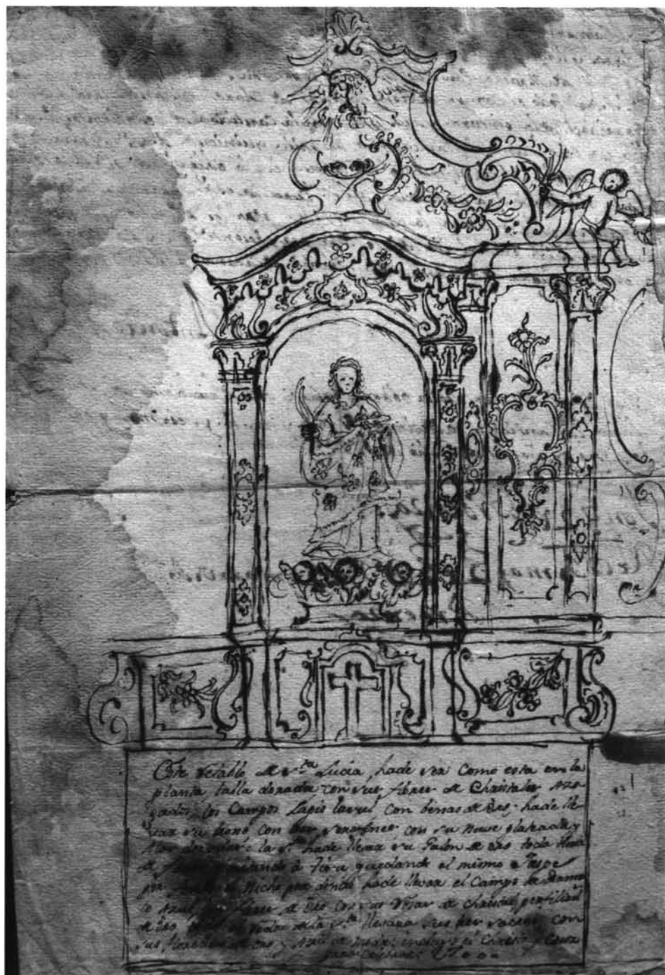
Foto 1. Trazas del Retablo de Santa Lucía. Portada.