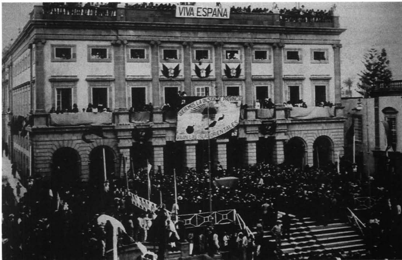
LÁM. 2. Fachada del Ayuntamiento de Las Palmas de Gran Canaria. Importante documento gráfico que recoge la visita del rey Alfonso XIII, y en el que se reclama la división del archipiélago en dos provincias; fenómeno suscitado desde el siglo XIX.