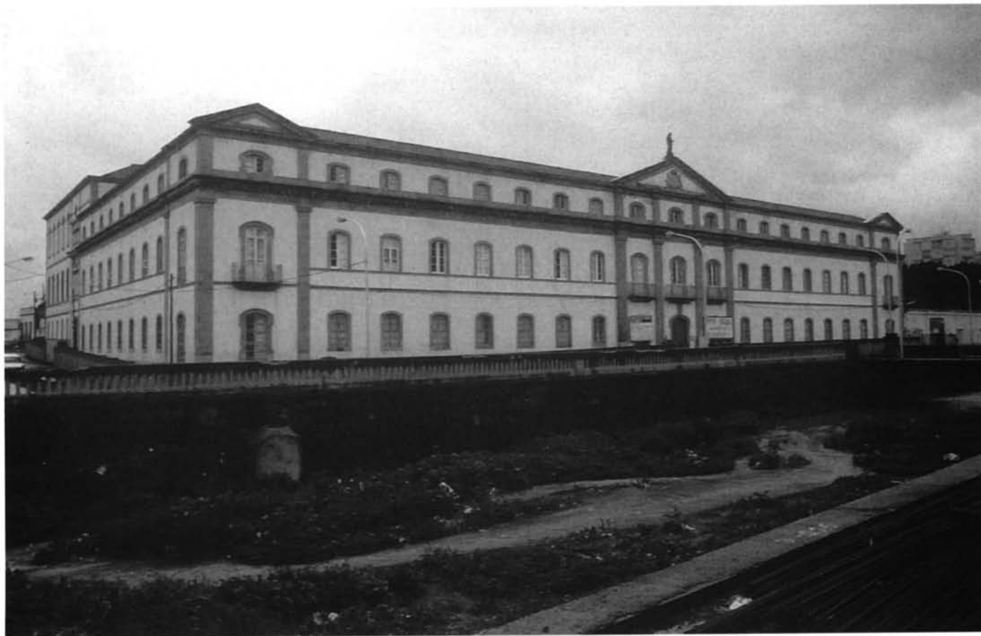
LÁM. 5. Hospital civil de Santa Cruz de Tenerife. A través de las fachadas acompasadas de los nuevos edificios decimonónicos, la ciudad adquiriría una imagen monumental.