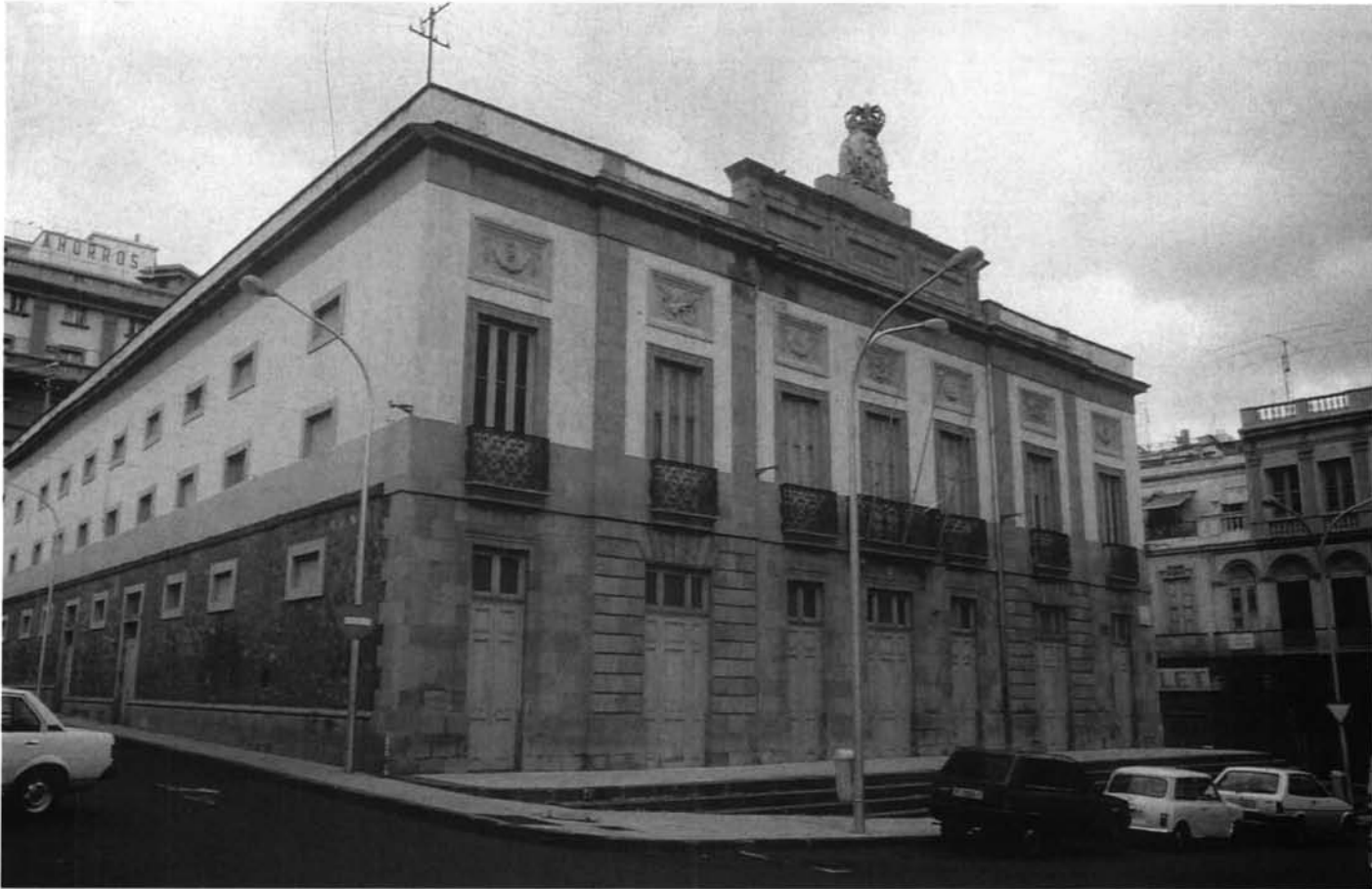
LÁM. 4. Teatro Guimerá, en Santa Cruz de Tenerife. Marco adecuado para difundir los nuevos ideales; el carácter público de estos edificios estaba supeditado a su función instructiva y moralizante.