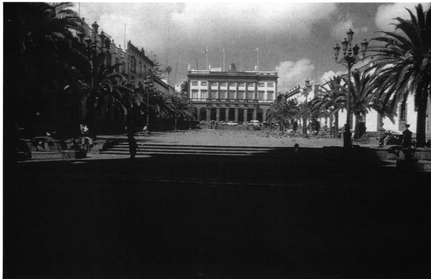
LÁM. 1. Plaza de Santa Ana y Ayuntamiento de Las Palmas de Gran Canaria. Núcleo espacial de evidente carácter representativo, donde convergen los edificios-símbolos de poder.