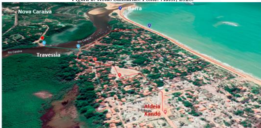
Figura 2: Rotas Sanitárias.

Este modelo tem o intuito de propor rotas sanitárias visando a proteção das comunidades nativas – evitando a passagem entre as áreas residenciais – e informando os turistas e visitantes caminhos recomendados para os principais pontos de turismo e lazer da região.