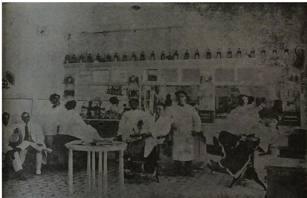
Fuente: La Redacción, “La peluquería Salón Crusellas”. La Higiene , Mérida, 1 de octubre, 1918, 219.

Otro texto mencionó las características del Hotel Madrid ubicado en el cruce de las calles 58 y 59 del centro de la capital. La revista publicó fotografías del interior de las recamaras (cama, escritorio, cortinas, sillas, sábanas y colchón) y aseguró que la dueña se había encargado de que se encontraran “higiénicas y elegantes”, por lo que se consideraba que su construcción “garantizaba la salud de sus moradores y huéspedes” (Imagen 4). Por último, los redactores añadieron que si todos los propietarios de hoteles tuvieran como ejemplo al Hotel Madrid “la sociedad se sentiría orgullosa de prestar alojamientos decentes, confortables y pulcros a todo viajero”. 43