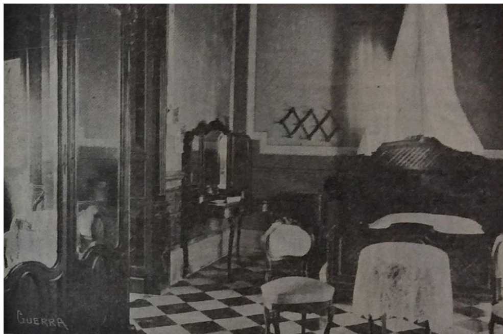
Fuente: La Redacción, "El Hotel Madrid". La Higiene , Mérida, 1 de noviembre, 1918, 253.

En los dos casos presentados queda de manifiesto que era importante promover una dualidad entre el deber cívico y la higiene. Con los mensajes del órgano de información de la JSS los comerciantes de Yucatán tenían que ser conscientes de la manera en que podían ayudar a conservar la salud pública y cuáles eran sus deberes hacia la sociedad de la que formaban una parte importante. Así, si eran instruidos para adquirir hábitos higiénicos propagarían esos principios entre sus trabajadores y sus consumidores garantizando una vida más sana para toda la población. Por ese motivo cada uno de los ejemplos citados contenía descripciones detalladas y eran acompañados por una página donde, a manera de historieta, se presentaban imágenes que ilustraban el texto para ofrecer una lectura sencilla.