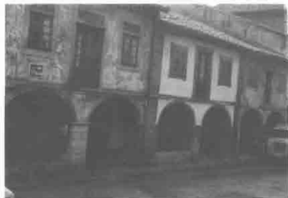
Casas de estilo popular. Calle de Galiana núms. 23-25-27.

Construido a finales del siglo XVII por iniciativa de don Rodrigo García Pumarino, cuya for-