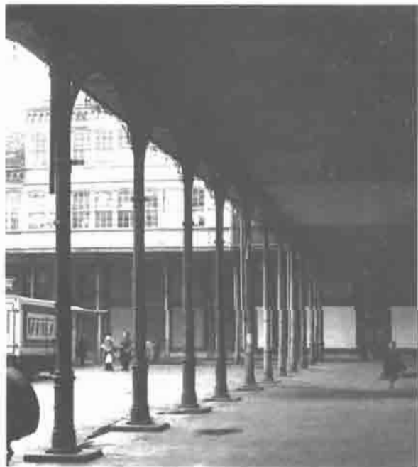
Plaza de Abastos o de las Aceñas.

En el Avilés «fin de siglo» se remozaron importantes sectores urbanos, tales como la Calle de la Fruta, la de la Muralla, la Cámara y San