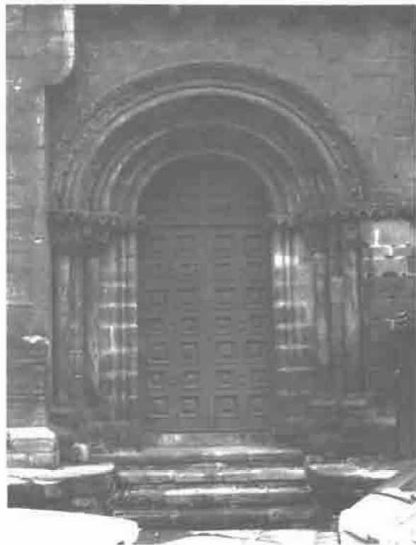
Portada sur de Santo Tomás de Sabugo.

guo barrio pesquero de Sabugo, que en la Edad Media formaba una localidad independiente, vinculado durante siglos a la vida del gremio de mareantes, la cronología de este templo resulta un tanto problemática ya que fue remozado en los siglos XV y XVIII. El grueso del edificio debe datar de finales del siglo XII, con algunos elementos de comienzos del XIII. Consta la iglesia de nave rectangular y ábside semicircular precedido de un tramo recto y separado de la nave por medio de arco de triunfo. Posee dos portadas de estilo románico: la Oeste y la Sur. La portada occidental es ligeramente apuntada, evidenciando como la de San Nicolás un carácter protogótico. Presenta como aquella molduras lisas en las arquivoltas, salvo la exterior con motivos ornamentales cuadrifolios; los capiteles de las columnas son figurados; el tejazoz es sencillo, con canecillos lisos. La portada Sur es en arco semicircular con arquivoltas sobre cuatro columnas. El ábside de Santo Tomás es el único de los románicos conservados en la villa. Presenta dos columnas contrafuertes que lo recorren en toda su altura. Su cornisa aparece apoyada en una sucesión de canecillos esculpidos. El interior posee bóveda nervada en la nave sobre contrafuertes, con capillas abiertas al costado Norte, como mínimo todo ello del XV avanzado. El arco triunfal, apuntado y de elevada proporción,