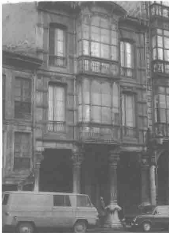
Calle San Francisco n.º 16.