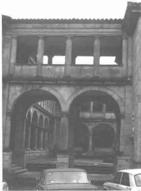
Claustro de S. Nicolás.

El actual aspecto del claustro está condicionado por las últimas reformas (1958-1965) llevadas a cabo por el arquitecto don Enrique R.