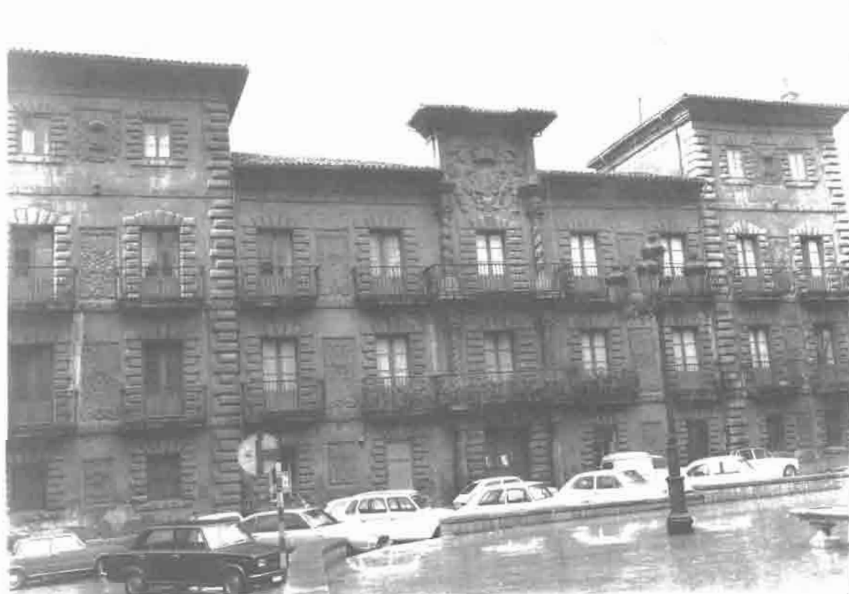
Palacio de Camposagrado, fachada «decorativa».