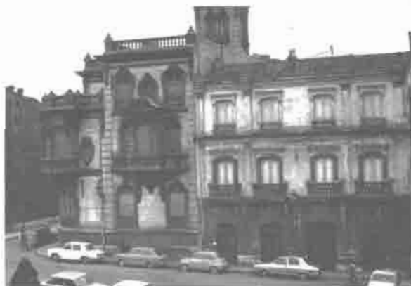
Palacio de Balsera.

Varias viviendas ofrecen ejemplos de un Historicismo ecléctico en el que se combinan elementos estructurales y especialmente ornamentales de muy diversa procedencia. Destaca dentro de esta corriente la espléndida mansión palaciega denominada localmente Palacio de Balsera o de Sendón, dando a la Calle Julia de la Riva y a la Plaza A. Acebal, con un amplio parque. El exterior presenta un interesante juego de volúmenes ascendentes, desde el chaflán curvado en el ángulo a la esbelta torre de inspiración historicista. Destaca la superabundancia ornamental con