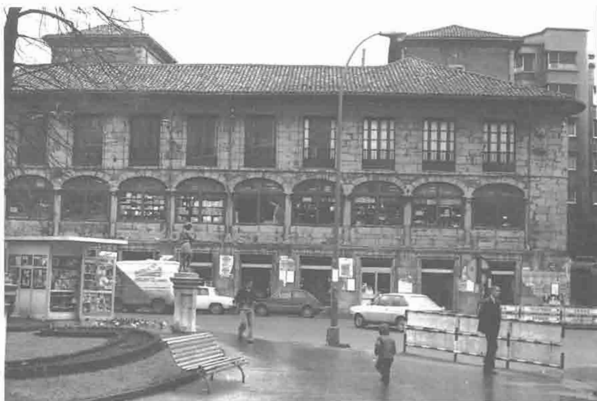
Palacio de Camposagrado, fachada norte.