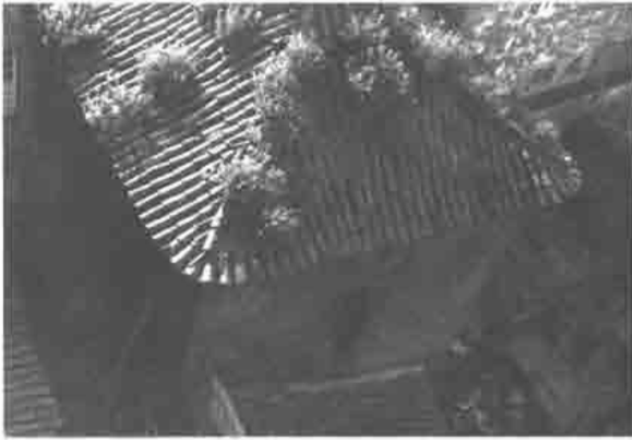
Capilla de los Alas desde la azotea de la Residencia franciscana.