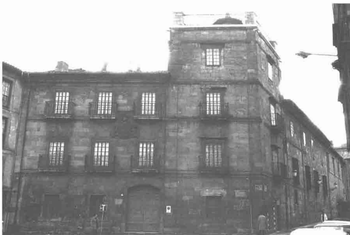
Palacio de Ferrera. Avilés.

calidad visual tanto desde la Plaza de España como desde la Calle de San Francisco. La parte posterior da al Parque de Ferrera, hoy propiedad municipal. En la Calle de Rivero, en el muro que delimita el parque, existen dos curiosos pabellones en forma de pequeñas torres rematadas en chapitel, de planta cuadrada y con cuatro vanos adintelados. Sus ángulos así como todo el cuerpo superior están ejecutados en sillares de piedra bien escuadrados. Uno de ellos limita la pequeña plazoleta semicircular que alberga la fuente denominada de «los Caños de Rivero»; el otro hace esquina con la calle adyacente. Ambos pabellones, lo mismo que la curiosa escena que alberga el parque, se hallan en un estado de conservación bastante precario.