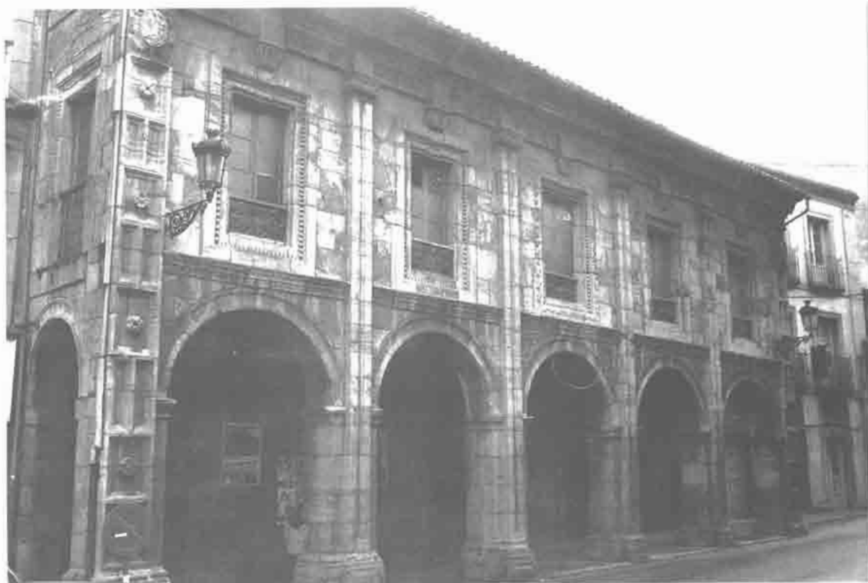
Palacio Llano Ponte, Avilés.