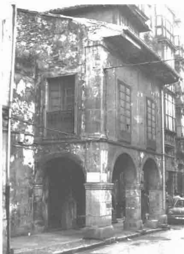
Vivienda porticada calle Rivero n.º 18.

b) Casa de doble planta con fachada ordenada en el bajo en soportal con arcos de medio punto sobre pilares en piedra. Sobre el piso se abren balcones, predominando el número de tres. Los cortafuegos se suprimen, ofreciendo la casa un balcón lateral abierto sobre el lado menor del pórtico que mira a la calle. Es éste un tipo muy representativo de la villa y debió de estar muy extendido en el pasado. Se halla perfectamente ejemplificado especialmente en Galiana donde los números 23, 25 y 27 presentan en el piso, balcón enmarcado por ventanas. El n.º 6 de la Calle de la Estación y el n.º 18 de la Calle de Rivero, ambos en estado de semirruina, conectan con este esquema y constituyen reliquias de zonas asoportalladas en arcos de medio punto hoy perdidas. No hay que olvidar que con esta formulación se relacionan también varias cons-