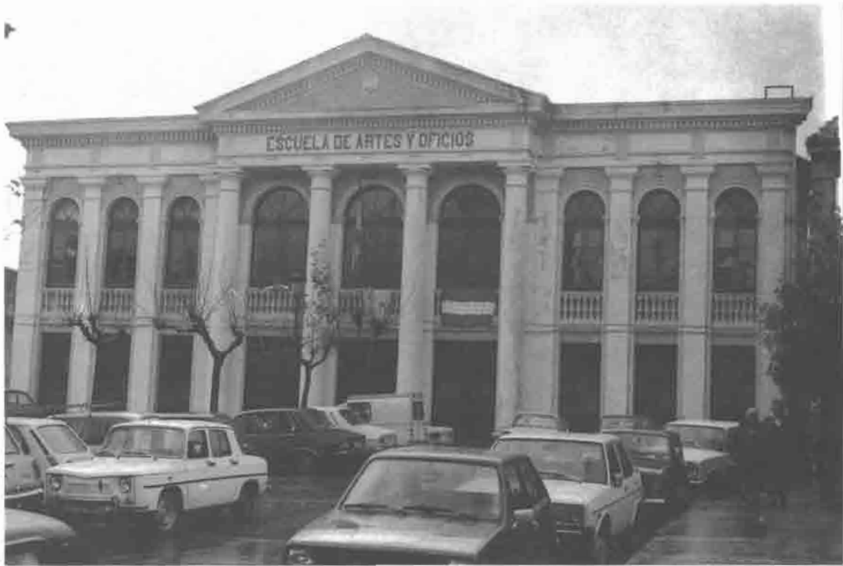
Fachada de la Escuela de Artes y Oficios.

En la villa existen otros ejemplos significativos de este estilo (Fernández Balsera, 4; Rui Gómez, 23; Estación, 16; esta última de pequeñas dimensiones).