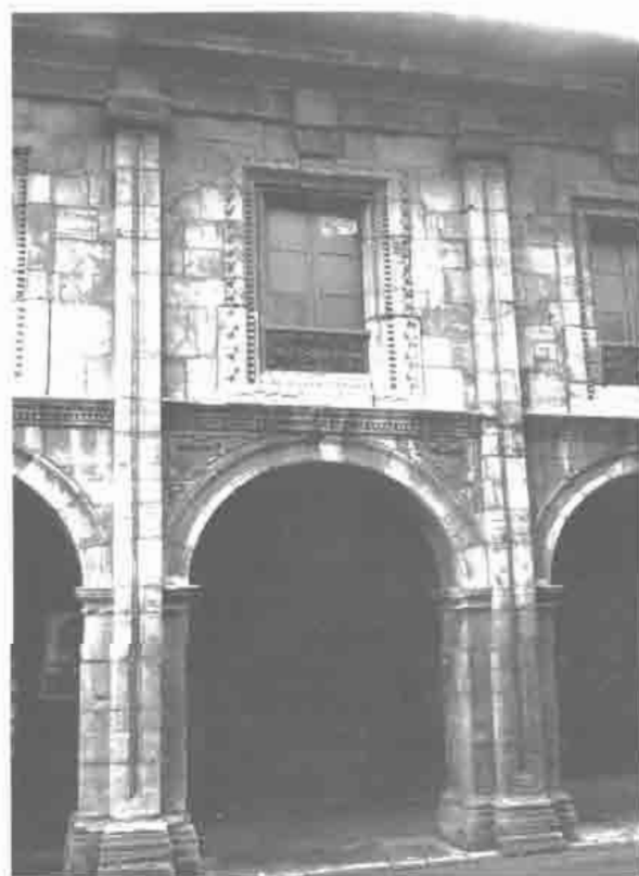
Palacio Llano Ponte, Avilés.

tuna, como tantas otras de la época se gestó en América (Indias de Perú), lleva esta casa el nombre de los Ponte debido a que el año 1774 se hizo una escritura en favor de don Francisco de Llano Ponte. De este interesante palacio emplazado en la Plaza Mayor, a la entrada de la Calle de Rivero, sólo se conserva la fachada. En otro tiempo como indica Rodríguez Bustelo (19), tenía «un típico y evocador patio de pequeñas dimensiones, de gran sabor renacentista y ambiente romántico y novelesco», tratándose posiblemente de un patio distribuidor de las diversas dependencias. Transformado su interior en sala cinematográfica, no conserva hoy ni rastro de su ordenación interna. En este palacio sitúa Armando Palacio Valdés la acción de su célebre novela «Marta y María».