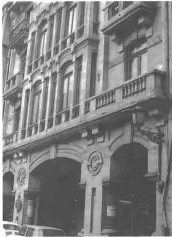
Calle de San Francisco n.º 2.

En la arquitectura de comienzos de siglo, cabe destacar también el interés del conjunto integrado por los números de la Calle San Francisco comprendida entre el 2 y el 16, grupo de viviendas de cierta homogeneidad, con un estilo que va del eclecticismo de tipo regional al matiz modernista (n.º 16) o Déco (n.º 2). Destaca dentro del conjunto el pintoresco efecto de las columnas en forma de hueso estilizado del bajo asoportalado del n.º 16, con repertorio ornamental dinámico y curvilíneo típicamente modernista en los pisos, así como el rigor de líneas y ángulos rectos del n.º 2. El n.º 6 de la Calle Llano Ponte, con fachada revestida de azulejo verde en el cuerpo central, se relaciona con el Art Déco por el geometrismo de la línea, presentando en cam-