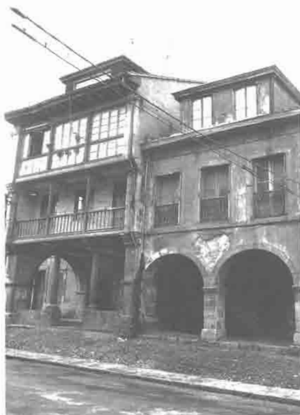
Calle Carballado núms. 62-64.

interés de los números 10, 15 y 25, éste último el más relevante de la calle y con el que termina el tramo practicado de los números impares). La pronunciada sobriedad ornamental de este grupo de casas de aspecto hidalgo, sólo se ve interrumpida por algún escudo nobiliario.