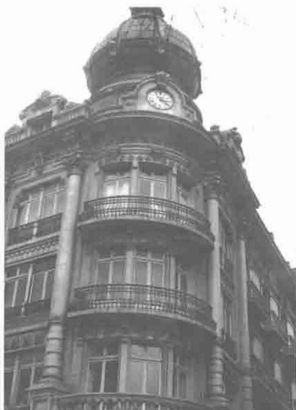
Edificio del Banco Español de Crédito.

de los órdenes gigantes articulando los pisos y esbeltas linternas rematando las rotondas «de esquina». Dotan las rotondas de gran prestancia y dignidad a los exteriores. El Palacio de Josefina Balsera centra los valores ornamentales en los pisos y linterna de la rotonda, jugándose con la policromía. Resalta el orden corintio gigante, los frontones y remates historicistas. El interior ha sido muy remozado, precisando la fachada de una buena limpieza.