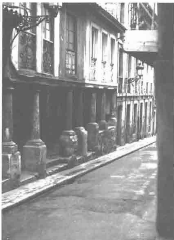
Vista de la calle Bancos Candamo.

época de importantísimas construcciones, tanto en las ciudades como en el ámbito rural. Avilés ha conservado el mejor conjunto de edificios civiles y la planificación urbana más interesante de la Asturias moderna. La villa puede ser considerada como un compendio de arquitectura barroca asturiana, en el que los tipos más relevantes en el campo de lo civil se hallan perfectamente representados. Baste mencionar la ordenación de la Plaza Mayor (Plaza de España) presidida por las líneas sobrias del Ayuntamiento, réplica del ovetense, sus mansiones porticadas y los Palacios de Llano Ponte, versión ornamental de la fachada consistorial, y de Ferrera, de volúmenes recios, elementos todos ellos que contribuyen a delimitarla y definirla. La obra maestra del barroco avilesino es sin duda la fachada «decorativa» del Palacio de Camposagrado, soberbia ilustración de los nuevos derroteros que sigue el estilo a fines del XVII. Importantes sectores con construcciones domésticas del Avilés moderno en las calles de Galiana, Rivero, Ferrería y Bancos Candamo, con sus casas de soportal que van de lo popular a lo hidalgo y que dan sabor y semblante propio a la villa, se hallan en muchos casos en pésimo estado de conservación. Recordemos, entre otros casos, el n.º 25 de la Calle de la Ferrería (S. XVIII), ejemplo de mansión a caballo entre lo formal y lo popular, o el n.º 6 de