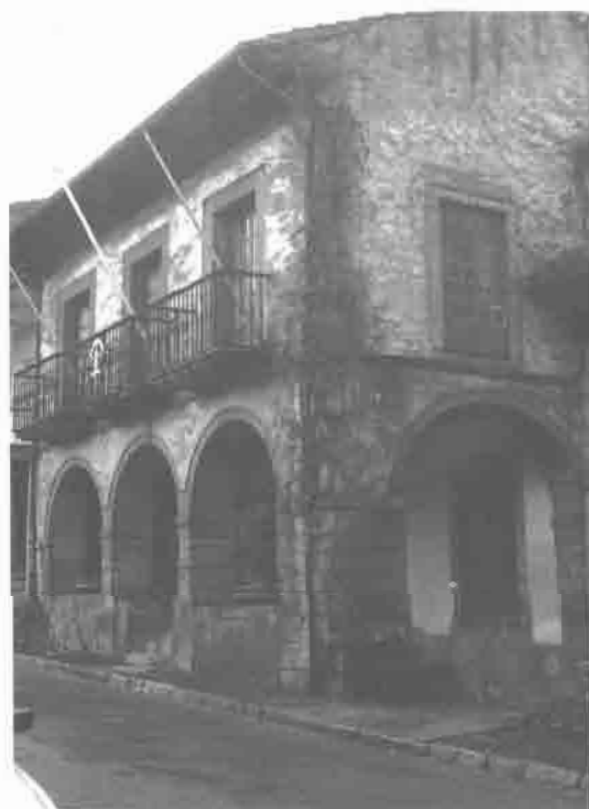
Casa porticada. Calle de Galiana n.º 18.

Repercusiones de esta tipología de fachada se observan en sectores del casco viejo más o menos alejados de la plaza, como en varias casas del XVIII de la Calle de la Ferrería, edificadas en solares con una tipología parcelaria preestablecida, condicionada por su origen medieval. Varias de estas construcciones en piedra de sillares regulares y pisos separados por líneas de impostas, con el característico soportal en arcos de medio punto, con antepechos en voladizo de hierro en los pisos y cornisas y aleros pronunciados, reflejan la influencia del Ayuntamiento. Dentro del conjunto de la calle, cabe destacar el