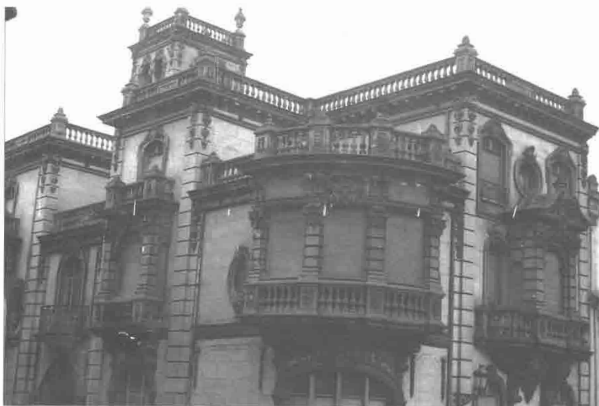
Palacio de Balsera o Sendón. Detalle.

elementos formales eclécticos, platerescos y barrocos, juntamente con algunos aspectos de carácter modernista como la puerta principal o la rejería de hierro en el bajo del chaflán curvado. Se valora el contraste cromático entre la piedra oscura de esquinales, cornisas y balaustradas de remate con la superficie clara de los muros. El interior conserva la ornamentación de la época, no habiendo sufrido reformas importantes. Data de la segunda década del siglo XX y fue construido por el arquitecto Palacios. Goza de una destacada calidad visual realzando el valor del sector urbano en el que se halla emplazado. Dentro de esta misma línea pueden mencionarse otra serie de casas de interés, si bien de una escala y unas proporciones más reducidas: el n.º 18 de la Calle Palacio Valdés, con una fachada decorada con bellos motivos florales y rejerías de sabor modernista o el n.º 16 de la Calle de Pablo Iglesias con fachada de doble piso cuyos vanos aparecen rematados en copetes con abundante decoración menuda de carácter floral.