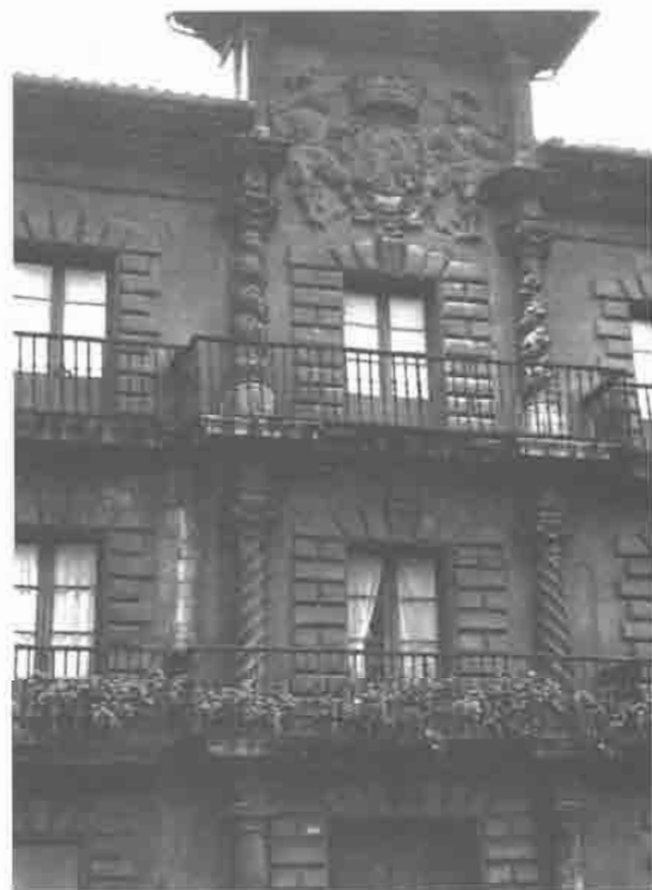
Cuerpo centrado de la fachada «decorativa» del Palacio de Camposagrado.

fachada principal, que recuerda dentro de un desarrollo más complejo la de la Casa de Pedro Valdés en Gijón, perdiendo no obstante el aspecto de fortaleza, destaca por su rica ornamentación. En las esquinas y marcos de los vanos se utiliza aparejo almohadillado. El núcleo central tiene tres pisos y cuatro las torres de los lados. La calle central se acentúa y se enfatiza por medio de la superposición de órdenes, con un primer piso toscano, un segundo de columnas torsas, de estrías helicoidales y en el superior la irrupción de la columna salomónica con hojas y racimos de vid, primer y único ejemplo de aparición de este tipo de columna –tan barroco– en un exterior asturiano (21). También se destaca esta calle central por medio de un ático de remate con escudo (22). Los vanos poseen balcones con antepechos en hierro. La estructura general es reticulada, apareciendo numerosos elementos decorativos (grandes florones, escudos, frisos de triglifos alternando con rosetas). Esta fachada a la plazuela sigue un posible proyecto de Francisco Menéndez Camina, el arquitecto más importante de Avilés a fines del XVII, cuya obra supone el triunfo del decorativismo barroco en la región. Se conocen los nombres de tres maestros de cantería contratados para la ejecución de la fachada: Agustín Martínez, Domingo de Fiestas e