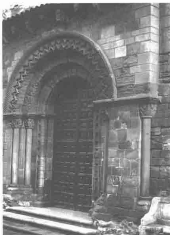
Portada de la antigua Iglesia de S. Nicolás.

cubierto de madera, reservándose la bóveda solamente para la capilla mayor.