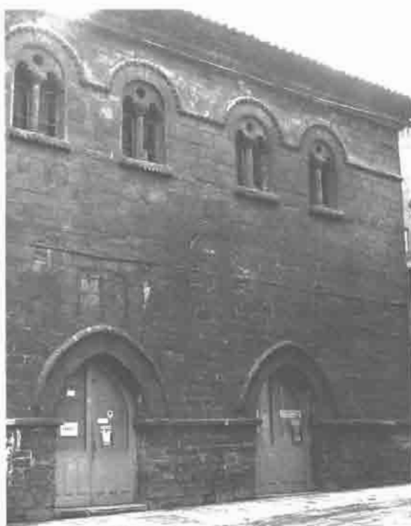
Casa de las Baragañas. Lateral. Avilés. Calle de la Ferrería.

Data la Casa de las Baragañas del siglo XIV. Cuenta la tradición que por esta casa pasó el rey Don Pedro el Cruel cuando vino a Asturias en