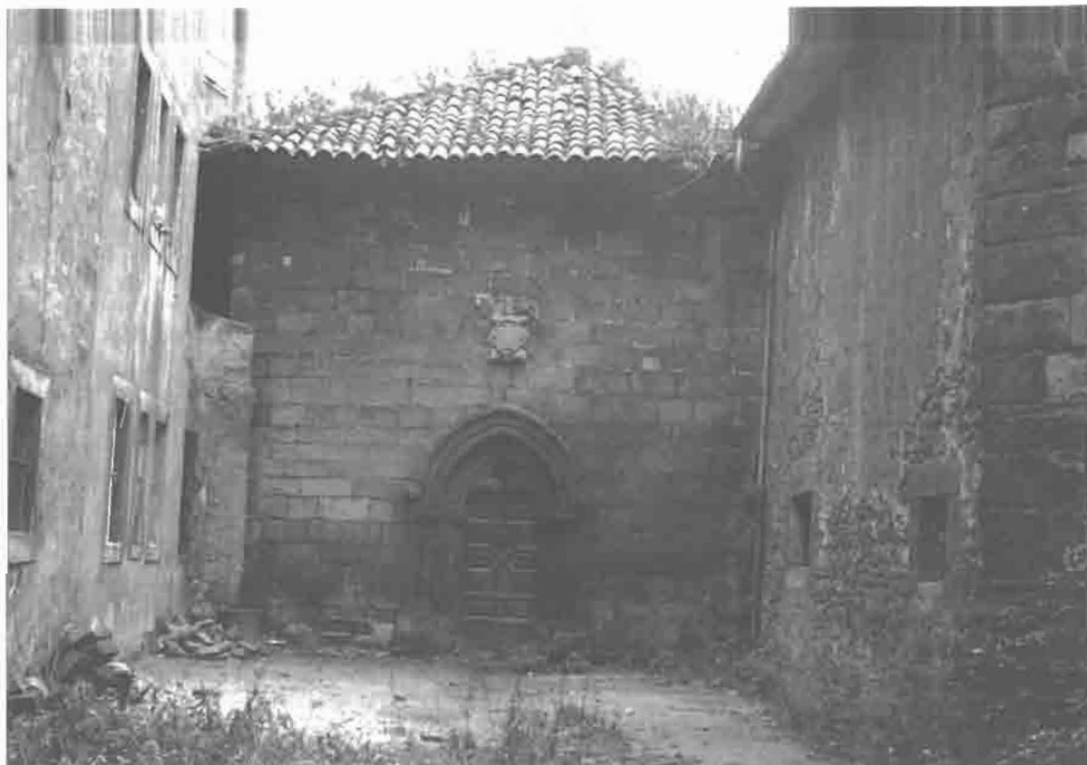
Capilla de los Alas: vista del lado de la portada.

La Capilla de los Alas es sin duda la joya del gótico en la villa de Avilés; sus reducidas proporciones, lejos de disminuir su interés, la dotan de un especial atractivo. Se trata de una cons-