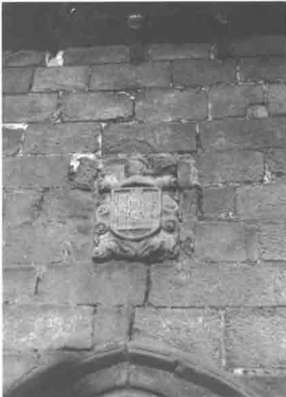
Capilla de los Alas. Detalle del exterior.

trucción gótica a pequeña escala que sintetiza con coherencia la nítida y recia sencillez de volúmenes de su severa estructura cúbica y los refinados trazos de las molduras ojivales. Emplazada en el lado septentrional del antiguo cementerio, fue erigida por la familia de los Alas (2), la más noble y poderosa de la villa en el siglo XIV, época de hegemonía aristocrática en los reinos hispanos. Probablemente en su día fue una capilla exenta, adosada al templo con el remozamiento moderno. Los muros desnudos son de buen aparejo isodomo y presentan solamente dos vanos: el de la puerta de acceso al oeste y una ventana al este, ambos enmarcados por molduras