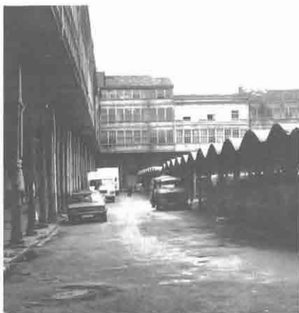
Plaza de las Aceñas.

Francisco, surgiendo en todas ellas diversas residencias burguesas que van adoptando los sucesivos estilos en boga. Las transformaciones urbanísticas no sólo fueron periféricas, sino que afectaron también sectores considerables del casco viejo, si bien no se alteraron excesivamente los trazados tradicionales.