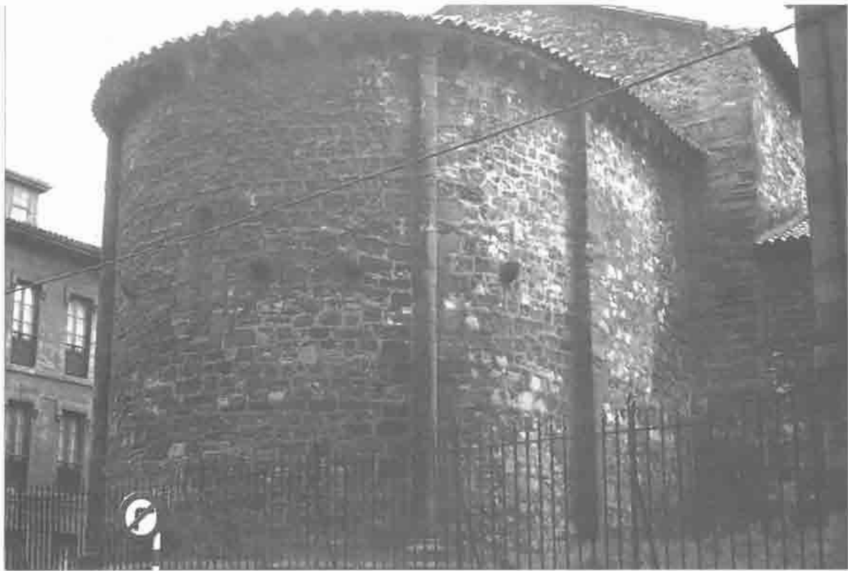
Abside de Santo Tomás de Sabugo.

guo barrio pesquero de Sabugo, que en la Edad Media formaba una localidad independiente, vinculado durante siglos a la vida del gremio de mareantes, la cronología de este templo resulta un tanto problemática ya que fue remozado en los siglos XV y XVIII. El grueso del edificio debe datar de finales del siglo XII, con algunos elementos de comienzos del XIII. Consta la iglesia de nave rectangular y ábside semicircular precedido de un tramo recto y separado de la nave por medio de arco de triunfo. Posee dos portadas de estilo románico: la Oeste y la Sur. La portada occidental es ligeramente apuntada, evidenciando como la de San Nicolás un carácter protogótico. Presenta como aquella molduras lisas en las arquivoltas, salvo la exterior con motivos ornamentales cuadrifolios; los capiteles de las columnas son figurados; el tejazoz es sencillo, con canecillos lisos. La portada Sur es en arco semicircular con arquivoltas sobre cuatro columnas. El ábside de Santo Tomás es el único de los románicos conservados en la villa. Presenta dos columnas contrafuertes que lo recorren en toda su altura. Su cornisa aparece apoyada en una sucesión de canecillos esculpidos. El interior posee bóveda nervada en la nave sobre contrafuertes, con capillas abiertas al costado Norte, como mínimo todo ello del XV avanzado. El arco triunfal, apuntado y de elevada proporción,