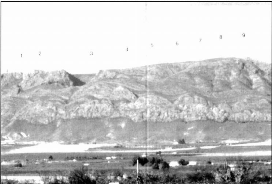
Parque eólico Sierra de Ascoy (Cieza).

Las regiones españolas con mayor potencia instalada eólica son las de Navarra, Galicia, Andalucía, Canarias, Aragón, Castilla y León, etc. Sobresalen parques como los de Tarifa