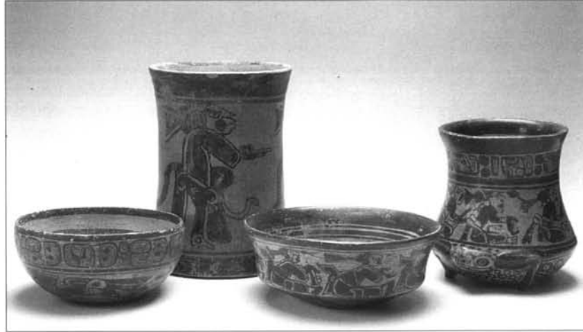
FIGURA 3: Cerámica Copador.

vaso el número de glifos varía, su orden de aparición siempre es el mismo; por consiguiente, el texto debería tener algún sentido. Las repeticiones podrían ser de orden natural o mágico.