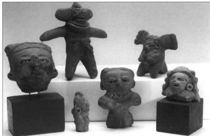
FIGURA 7: Figurillas.

De cerámica, macizas, casi siempre femeninas y desnudas, suelen ser muy numerosas y su función difícil de determinar, si bien parece ser que están unidas a ritos de fertilidad. Los rasgos faciales están simplemente indicados con incisiones o modelado, siendo la forma de los ojos una de las principales características para indicar la tipología: una ranura horizontal sobre una bolita de pastillaje, produciendo una sensación de ojos adormilados, (M.A.M. 89/1/13); o con dos punciones (M.A.M. 89/1/7). La nariz es corta y gruesa; la boca se realiza de manera similar a la de los ojos, con el labio inferior sobresaliente; las orejas, muy toscas, presentan profundos orificios para la aplicación de orejeras (M.A.M. 89/1/7), o ya modeladas (M.A.M. 89/1/16). Escasamente ornamentadas, lo más llamativo suele ser el tocado (M.A.M. 89/1/6, 89/1/17). Tan sólo una porta un collar formado por una sarta de perlas, realizado mediante pastillaje (M.A.M. 89/1/14). Casi todas presentan deformación craneana. (Figura 7).