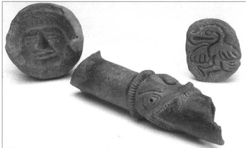
FIGURA 9: (M.A.M. 89/1/74, 89/1/70, 89/1/2).

Pintadera o sello. (M.A.M. 89/1/2), de forma ovalada, mediante profunda excisión, muestra la figura de un ave no identificada con las alas exployadas. Los sellos o pintaderas de arcilla resultan muy frecuentes en Guatemala y El Salvador y sus diseños se realizan a partir de una incisión y excisión profunda; los diseños suelen ser zoomorfos, como en el caso que nos ocupa, y geométricos. Aunque la forma más corriente es la de cilindro, también los hay cuadrados, rectangulares y ovales. Estos tipos últimos hacen que su diseño, al estamparlo, sea menos seriado que el de los cilíndricos. (Figura 9).