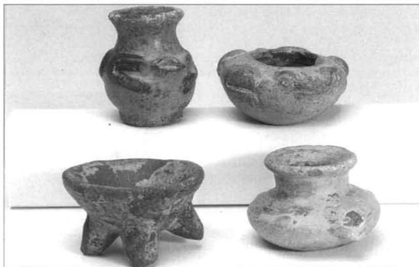
FIGURA 8: Vasijas miniatura.

Las vasijas (M.A.M. 89/1/4, 89/1/5, 89/1/71, 89/1/76) conforman este tipo de apartado y las encuadramos dentro de la cerámica de Usulután (200 a.C.-550 d.C.). Los tres primeros números representan, mediante modelado, aplicado e incisión, una rana, uno de los animales más frecuentes en la iconografía de la costa sur y bocacosta de Guatemala y El Salvador por su relación con el agua y la fertilidad. El (M.A.M. 89/1/76) es un cuenco tetrápodo. La vasija (M.A.M. 89/1/71) contiene restos de un pigmento rojizo, hecho que vendría a apoyar la finalidad de uso como instrumento para la escritura y pintura. (Figura 8).