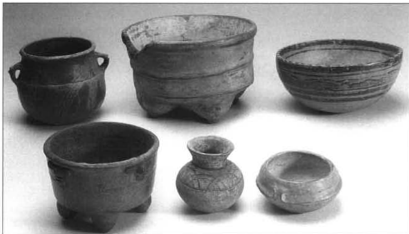
FIGURA 2: Cerámica Usulután.

La característica mayor de esta cerámica está en la decoración: pintura en negativo de líneas paralelas, generalmente onduladas, de color claro sobre fondo oscuro, (M.A.M. 81/1/25, y 89/1/26). Alcanzó gran popularidad, encontrándose desde el Sur de México al Norte de Nicaragua, pero su máximo desarrollo lo alcanzó en Copán y en El Salvador. Dado la complicación de esta técnica, en algunas zonas de las tierras bajas se imitó con la aplicación de dos o tres engobes. La cerámica Usulután también cultivó otras técnicas como la de aplicación e incisión (M.A.M.89/1/29) sobre vasijas con engobe blanquecino; suelen ser vasijas trípodes o tetrápodos mamiformes muy desarrollados (M.A.M.89/1/31 y 89/1/55). (Figura 2).