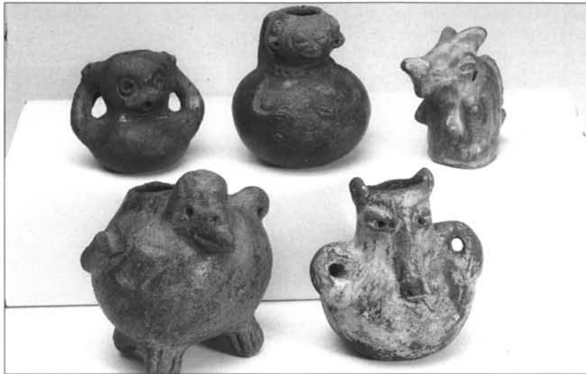
FIGURA 6: Vasijas zoomorfas.

decoración en rojo de líneas entrecruzadas sobre el cuerpo globular que simula el del animal. El nº M.A.M. 89/1/10 pertenece a una extraña figura, mezcla de rasgos antropomorfos y zoomorfos, de la que habría que comprobar su autenticidad.