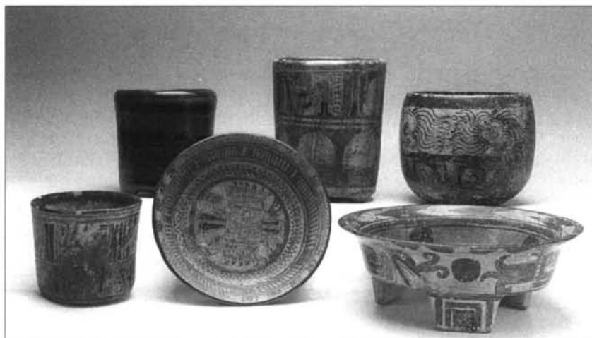
FIGURA 5: Cerámica Policroma Ulúa-Yojoa.

El corpus de vasos de la colección perteneciente a este apartado es notable en su calidad, siendo los más representativos los vasos cilíndricos (M.A.M. 89/1/27, 89/1/54), el vaso cilíndrico tetrápodo (M.A.M. 89/1/65) perteneciente al Babilonia policromo; la vasija semiesférica de altas paredes (M.A.M. 89/1/38), cuya decoración cubre, con un sentido de "horror vacui", toda la pared del vaso combinando, en dos frisos, los dibujos geométricos con la característica cabeza emplumada, con influencia del Cancique policromo de Comayagua; los platos trípodas (M.A.M. 89/1/50, 89/1/85); el plato (M.A.M. 89/1/82) cuyo motivo central parece recordar al "monstruo de la Tierra", deidad mexicana, y cuya técnica decorativa muestra influencia de la zona de Nicoya. (Figura 5).