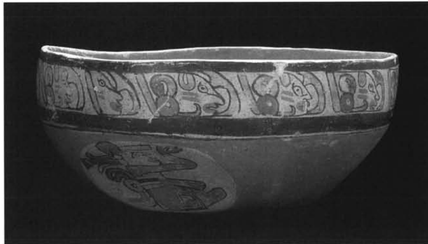
FIGURA 4: (M.A.M. 89/1/67).

Dentro de este grupo destacamos, por su singularidad tipológica, la vasija (M.A.M. 89/1/67): su forma semiesférica se ve interrumpida en torno a la base por tres achatamientos circulares en donde se inscriben otros tantos personajes masculinos sentados de perfil. Tanto en torno al borde, como en el interior muestra los característicos glifos. (Figura 4).