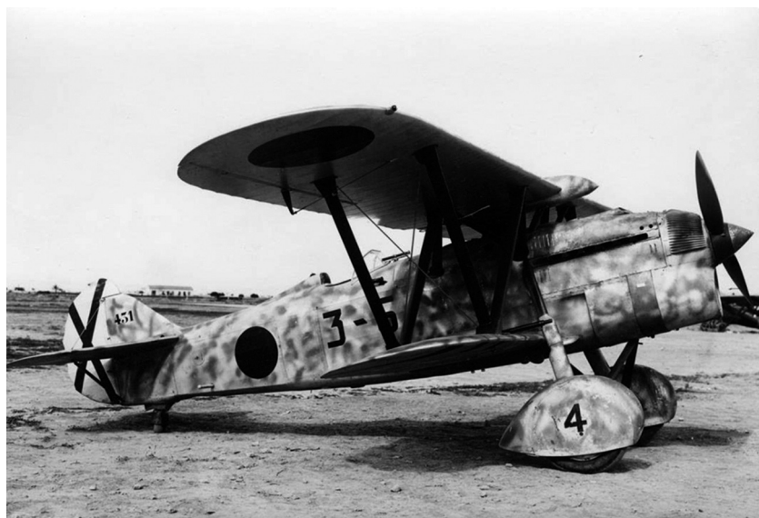
Avión de caza italiano Fiat CR.32. Fue el aparato de caza más empleado por los sublevados en el transcurso de la guerra española.