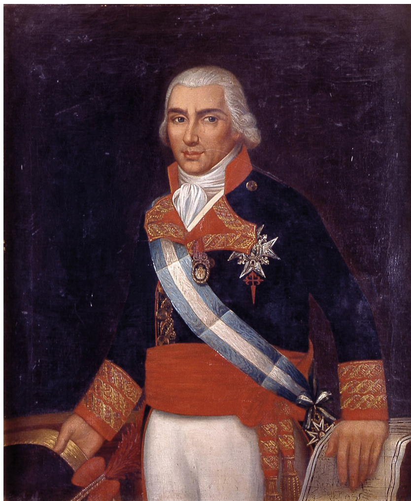
Anónimo, Retrato del «palermitano» Federico Gravina y Napoli, capitán general de la Real Armada. (Museo Naval de Madrid).

1.854.- Alejandro Malaespina . ¿Palermo? ¿Mulazzo?, 5 de noviembre de 1754. Asentado el 18 de noviembre de 1774. La familia parece ser que