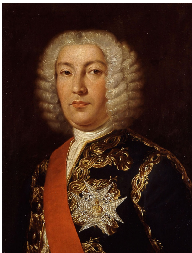
Rafael Tejeo, Retrato del «mesinés» Juan José Navarro de Viana y Búfalo, marqués de la Victoria, capitán general de la Armada. (Museo Naval de Madrid).