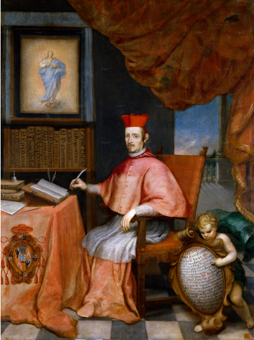
Alonso del Arco, Cardenal Juan Everardo Nithard. (Museo del Prado, Madrid).

tuvieron éxito sus peticiones de conseguir un mando significativo en el aparato militar hispano en la Península.