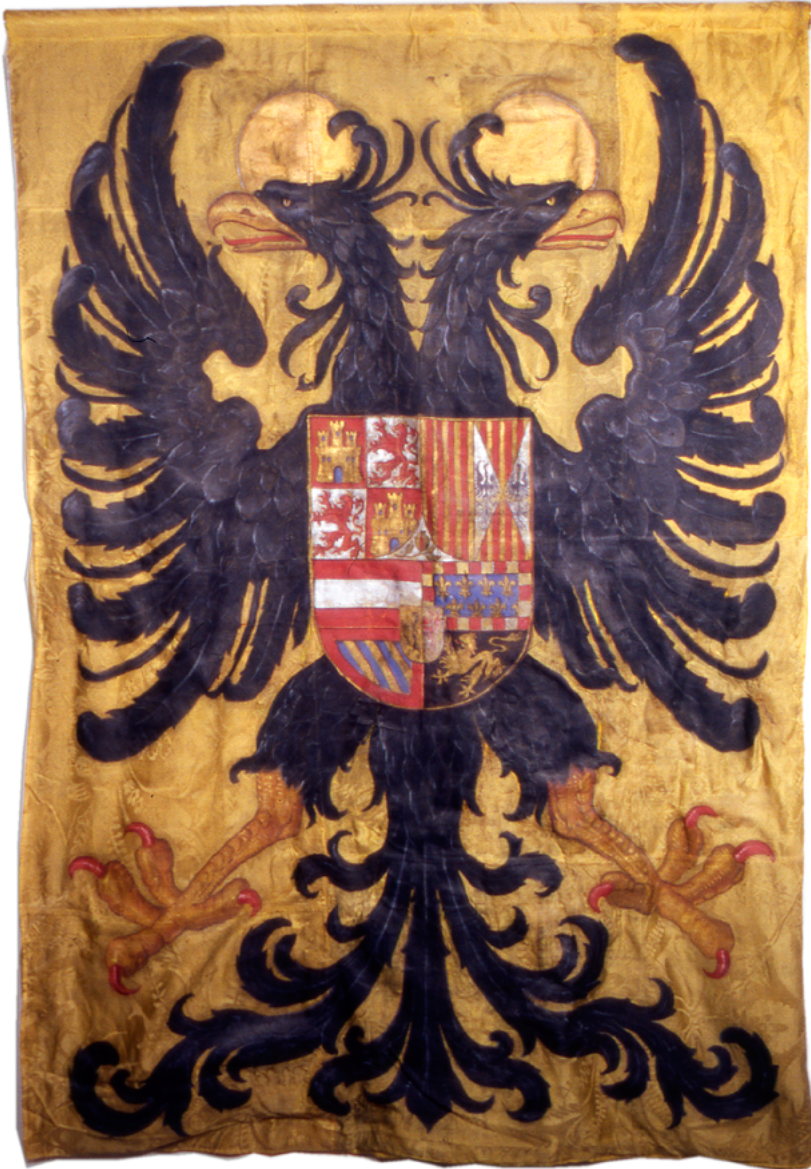
Bandera de Infantería de Carlos V. (Museo del Ejército, Toledo).

por Napoleón Bonaparte, aunque sus sucesores se siguieron intitulado emperadores hasta 1918, cuando los imperios austrohúngaro y alemán fueron abolidos. A partir de esa fecha nosotros seguiremos estudiando a estos soldados como germanos, aunque algunos ya eran austriacos y otros alemanes.