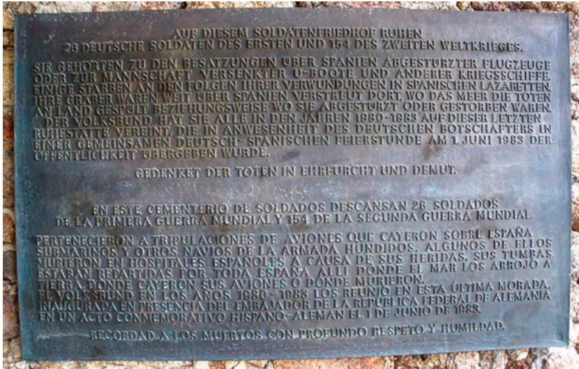
Cementerio militar alemán, inscripción. (Cuacos de Yuste, Cáceres).

«comando W», especial de la Legión Cóndor» 51 . La operación se mantenía en secreto: