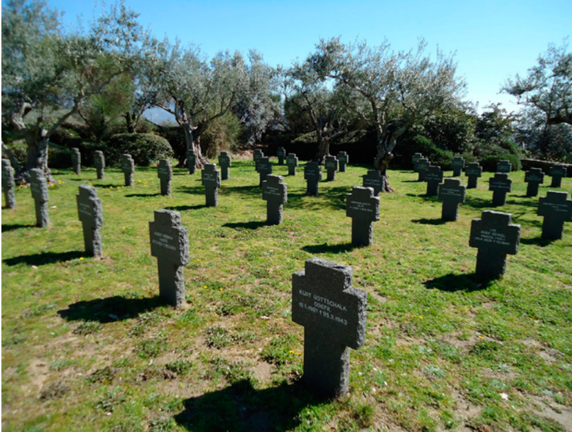
Cementerio militar alemán. (Cuacos de Yuste, Cáceres).

Y es que aunque el soldado obligado mostraba a veces una voluntad patente de servicio patriótico, otras su actitud reflejaba la renuencia del campesino que no entiende ni le importa una patria para él lejana o inexistente. En cualquier caso se trataba de un miembro de una colectividad que comenzaba a ser nacional, que se transformaba «de imperio a nación», construyendo poco a poco nuevos rituales y formas de comprensión de la milicia. Se sustituía el servicio a la monarquía por el servicio a la patria y el oficio de soldado pasaba a ser parte de la formación cívica del ciudadano. Esto era incompatible con la participación masiva de no-nacionales en la defensa del territorio. Aún así, en determinadas circunstancias, hubo personas provenientes de los países alemanes que actuaron en alguno de los ejércitos españoles y combatieron en ellos. La mayor parte vivió su experiencia en España durante una de las grandes guerras civiles de la contemporaneidad, ya fuera como voluntarios integrados en alguno de los contendientes o como parte de contingentes participantes en la guerra con vinculación externa. Aparte de ello, siempre ha habido casos de alemanes y austríacos de origen en la Legión española.