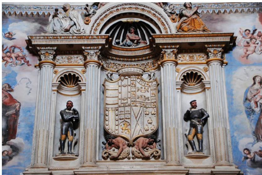
Lansquenets, Tumba del Gran Capitán (Monasterio de San Jerónimo, Granada).