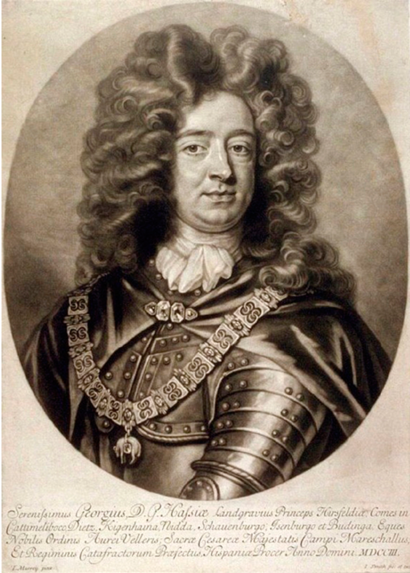
John Smith, Georg de Hessen-Darmstadt. (Fine Arts Museum of San Francisco online).

propugnaba el Almirante de Castilla se descartó porque no se podía contar con ningún apoyo local 12 . Siempre en correspondencia con los intereses ingleses, el nuevo punto de mira fue Gibraltar, la puerta hacia el Medite-