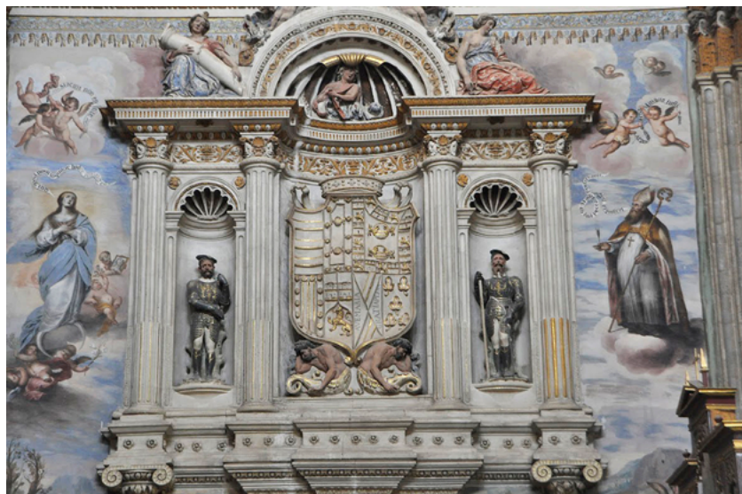
Lansquenetes, Tumba del Gran Capitán (Monasterio de San Jerónimo, Granada).

tenía una posición clave al controlar los pasos de los Alpes ya que estos constituían la vía de comunicación más importante entre Italia y el norte. Se trataba no solo del camino más cómodo, sino también del más seguro. Las vías de comunicación desde Milán a través del territorio de los Grisones o los territorios de la Confederación Suiza, o a través de Saboya hacia el norte, pasaban por pasos de mayor altitud y en parte atravesaban territorios protestantes y, en el caso de Saboya, muy cerca de la frontera francesa. El camino a través del Tirol era más largo pero, de cualquier modo, mucho más seguro que las rutas anteriormente mencionadas. A esto hay que añadir que el archiduque Fernando controlaba en Suabia zonas muy importantes por ser posesiones austriacas. No olvidemos que así era un vecino de los españoles en Alsacia. Y, finalmente, la mayor parte de los lansquenetes que debían servir en Italia eran reclutados en el Tirol y en Baviera, debido a que en estos territorios imperiales se podía garantizar que los lansquenetes eran católicos 62 .