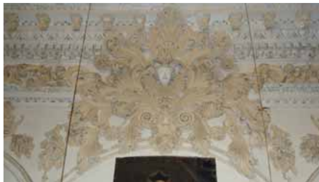
DETALLE DE LAS YESERÍAS QUE RECORREN EL INTERIOR DEL TEMPLO.

las instrucciones al obispo de Málaga don José Franquís Laso de Castilla. A partir de este momento las juntas de temporalidades provinciales y locales se aseguraron de que todos los bienes muebles e inmuebles, urbanos y rurales, fueran inventariados, acompañados de una tasación aproximada de cada uno de ellos. Para su realización se pusieron al frente, en la medida de lo posible, a expertos en la materia a inventariar.