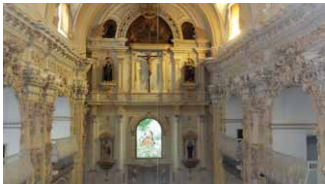
VISTA DEL INTERIOR DE LA IGLESIA HACIA EL RETABLO MAYOR, CON LAS TRIBUNAS Y SU DECORACIÓN EN LOS LATERALES.