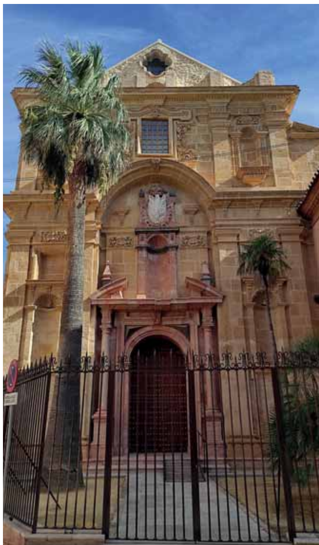
PORTADA DE ACCESO A LA IGLESIA DEL COLEGIO.