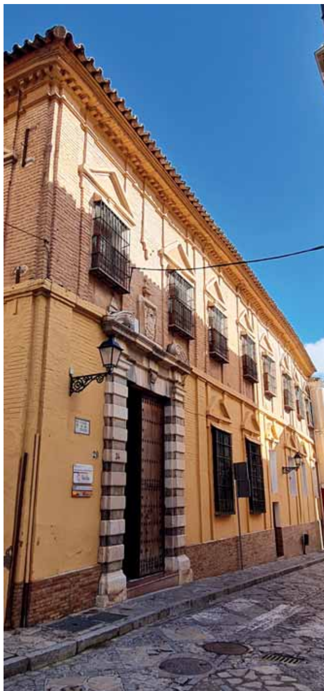
FACHADA Y PORTERÍA DEL ANTIGUO COLEGIO.