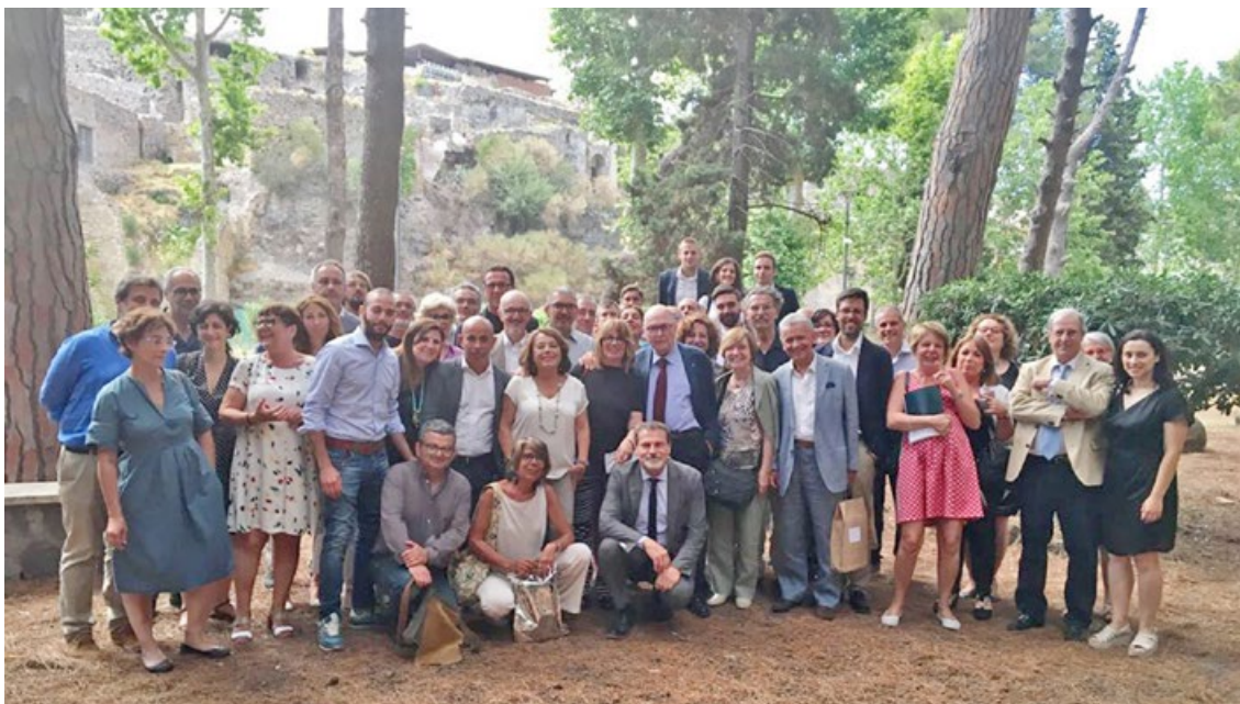
Homenaje de compañeros y discípulos con motivo de su ochenta cumpleaños. Pompeya, 28 junio 2017

Hölscher es el autor del texto «Omaggio a Mario Torelli» (pp. 27-28), una sentida evocación del amigo desaparecido y una adecuada valoración de la importancia de su obra científica, con consideraciones muy acertadas que ya adelantó durante su intervención en el acto celebrado on-line la tarde del 14 de diciembre de 2020 con motivo de la presentación en el Parco Archeologico di Paestum e Velia del libro de Torelli sobre el santuario extraurbano de Afrodita Urania de Paestum 7 aparecido ya póstumamente en el número 4 de Argonautica 8 , la colección de estudios de ese conjunto arqueológico. Le sigue nuestro escrito «Mario Torelli in memoriam . Evocaciones de su última década» (pp. 29-38) que recoge con algunas actualizaciones y añadidos la nota necrológica que apareció publicada en el número 20 (2020) del Anuario de la Real Academia de Bellas Artes